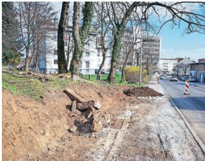
Gradnja kolesarske poti na Koroški cesti

V okviru projekta kolesarskih povezav 1–6 je načrtovana tudi gradnja enotne informacijske točke v največji stanovanjski soseski Planina. Gre za zidan objekt s skupno površino 173,4 m 2 , namenjen informiranju in ozaveščanju prebivalcev ter podpori kolesarjem in promociji trajnostne mobilnosti v Kranju. Ponovljeni razpis bo na portalu javnih naročil objavljen do vključno 15. 4. 2019. Če bo razpis tokrat uspešen, bo mogoče dela začeti že letos, v poletnih mesecih.