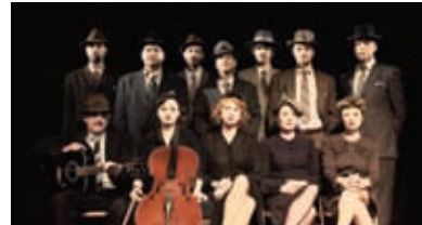
Zgodba drame temelji na resničnem dogodku – pogromu nad Judi na Poljskem, na šokantni resnici o tem, kdo ga je dejansko povzročil, ki je bila dolga leta zamolčana.