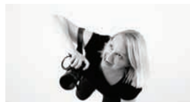
Multimedijske delavnice za otroke in mladino, kjer se bodo naučili, kako na ustvarjalen način uporabiti sodobno tehnologijo.