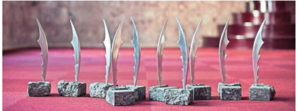
Kipci pričakujejo novega lastnika Grumove nagrade.