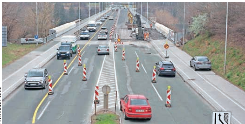
Spremenjen prometni režim na Delavskem mostu ne povzroča večje gneče, saj je bilo dobro poskrbljeno za obveščanje o obnovi in polovični zavori, ki bo trajala leto dni.

Začetek del v krožišču Bitnje je načrtovan maja, potekala pa naj bi osem mesecev. Glede na načrtovane posege naj na potek prometa ne bi imela večjega vpliva. V maju se bodo začela tudi pripravljana dela v krožišču Primskovo. Na začetku ne bodo posegala v cesto, glavna del pa bo potekala v času počitnic, od junija do avgusta. Izvajalec bo večino del opravil ob delnih zavorah oziroma z obvozi, to pa zato, da bo vse skupaj prometno vzdržno tudi zaradi sanacije Delavskega mostu. Zaključek prenovne krožišča na Primskovem je predviden oktobra.