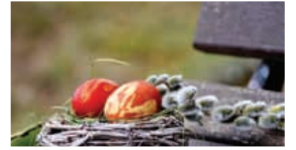
Obujanje in ohranjanje starih ljudskih običajev ob velikonočnih praznikih