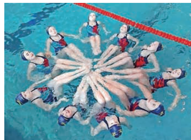
Skupina deklet v vodi, kjer prikazujejo popolnost pri gibanju