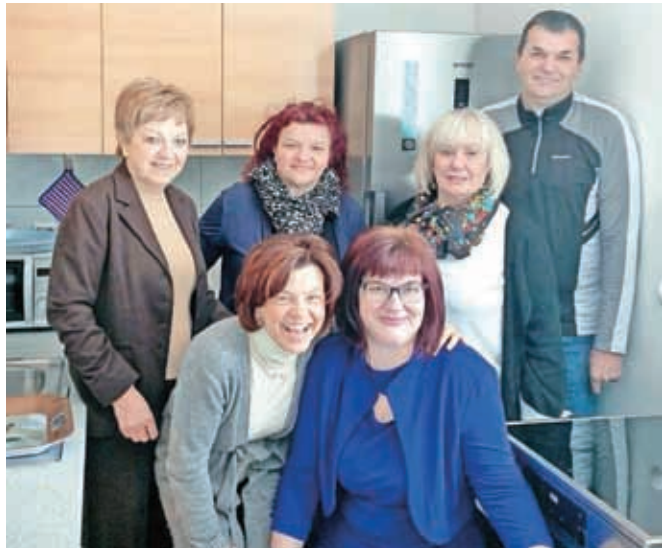
SKB banka je društvu Auris podarila gospodinjske aparate.

SKB banka je medobčinskemu društvu gluhih in naglušnih Gorenjske Auris podarila gospodinjske aparate, ki bodo njihovim članom omogočili dodatno razvijanje kuharskih veščin.