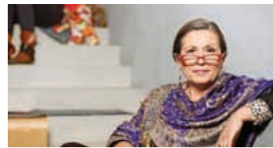
Doktorica socioloških znanosti. Antropologinja. Univerzitetna profesorica. Znanstvena publicistka. Kolumnistka. Avtorica več kot šeststo bibliografskih enot. Pronicljiva. Nepopustljiva. Kontroverzna.