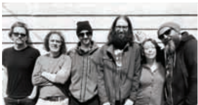
Skupina se bo na odru Trainstationa ustavila v sklopu turneje Kultur Shock z novim albumom D.R.E.A.M.