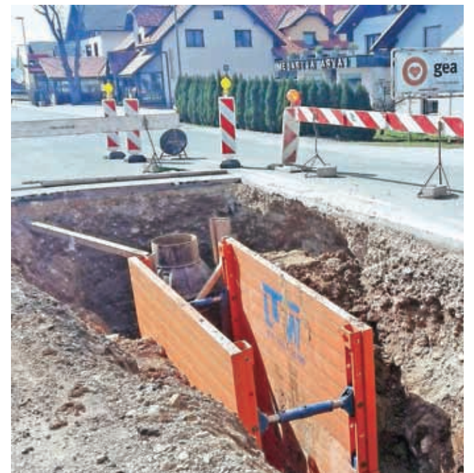
V Britofu se je gradnja komunalnih vodov že začela.

Mestna uprava, ki prosi za razumevanje v času gradnje v naseljih Orehovlje, Predoslje in Britof, vabi vse občane, ki jih projekt zanima ali