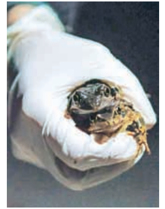
Žabe spomladi prečkajo cesto mimo Bobovka, zato bo ta v obdobju do konca aprila 14 nezaporednih dni zaprta.

niškega centra Naklo Kaja Frlic, ki na zavodu opravlja prakso. Popisuje in analizira stanje žab, njene ugotovitve pa bodo v veliko pomoč pri nadaljnjem načrtovanju zapor. Prvi višek letošnje selitve je bil v začetku marca, ko je bila omenjena cesta od 19. do 23. ure zaprta pet dni, obvoz pa je bil mogoč mimo bližnje vasi Srakovlje. Sonja Rozman pravi, da imajo v obdobju do konca aprila odrejenih 14 nezaporednih dni, o terminih zapor pa bodo obveščali sproti.