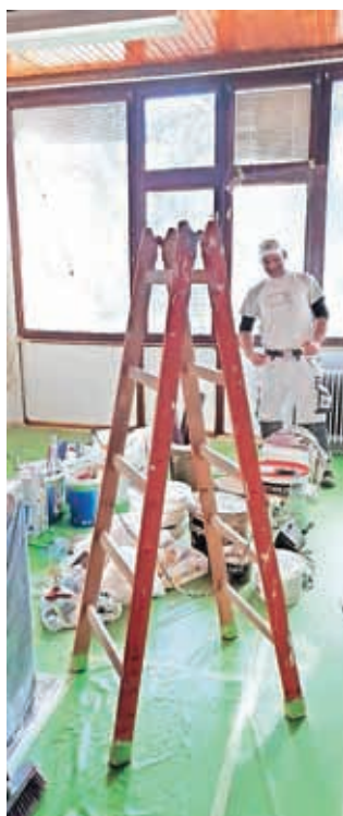
Prostor za širitev že urejajo.

Še vedno pa vas vabijo, da jim sporočite svoje želje in potrebe, kakšne vsebine bi si želeli slišati.