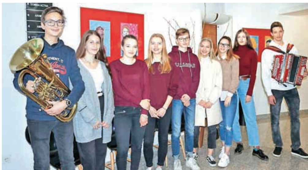
Odprtje razstave likovnih del dijakov Gimnazije Franceta Prešerna so z glasbo oplemenitili njihovi sošolci.