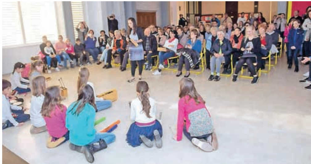
Prireditev ob prazniku Krajevne skupnosti Vodovodni stolp v Osnovni šoli Simona Jenka Kranj

V petek, na dan, ko obeležujemo mednarodni dan vode, je svoja vrata odrl vodovodni stolp, ki simbolizira kultur-