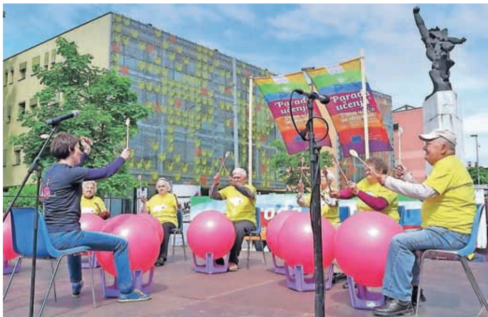
Teden vseživljenjskega učenja je vsako leto priložnost za druženja in predstavitve.

nja. Uradni del bo potekal od 11. ure dalje v Letnem gledališču Khislstein. Podelitev priznanj bo obogatena s kulturnim programom učečih se, torej udeležencev različnih oblik vseživljenjskega učenja in izobraževanja. Od 13.45 dalje bo v predverju Letnega gledališča Khislstein potekal tudi bogat spremljevalni program. V predverju bosta potekali tudi razstavi izdelkov udeležencev tečaja Keramika in uporabno lončarstvo Univerze za starejše pri LUK in razstava fotografij udeležencev tečaja Fotografije Univerze za starejše pri LUK. Na grajskem dvorišču bo razstava Praznik učenja, prav tako pa bo potekala delavnica izdelovanja papirja in pisanja s peresom. Hkrati pripravlja-