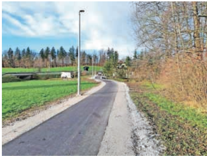
V letu 2018 je MO Kranj že uredila dva odseka na regionalni cesti.

dolžini 320 metrov. Z varno potjo ob tej regionalni cesti bodo največ pridobili predvsem najšibkejši udeleženci v prometu (otroci in kolesarji). Načrtovana dela na tem odseku, ki bodo vplivala na potek prometa (predvidena je polovična zapora ceste), bo izvajalo podjetje Euro grad iz Ljubljane, vrednost del pa je ocenjena na 152.848 evrov z DDV. Izvedba zadnjega odseka na regionalni cesti je v pristojnosti države. V kratkem bo predvidoma objavljen razpis za izbor izvajalca gradbenih del tudi na tem odseku.