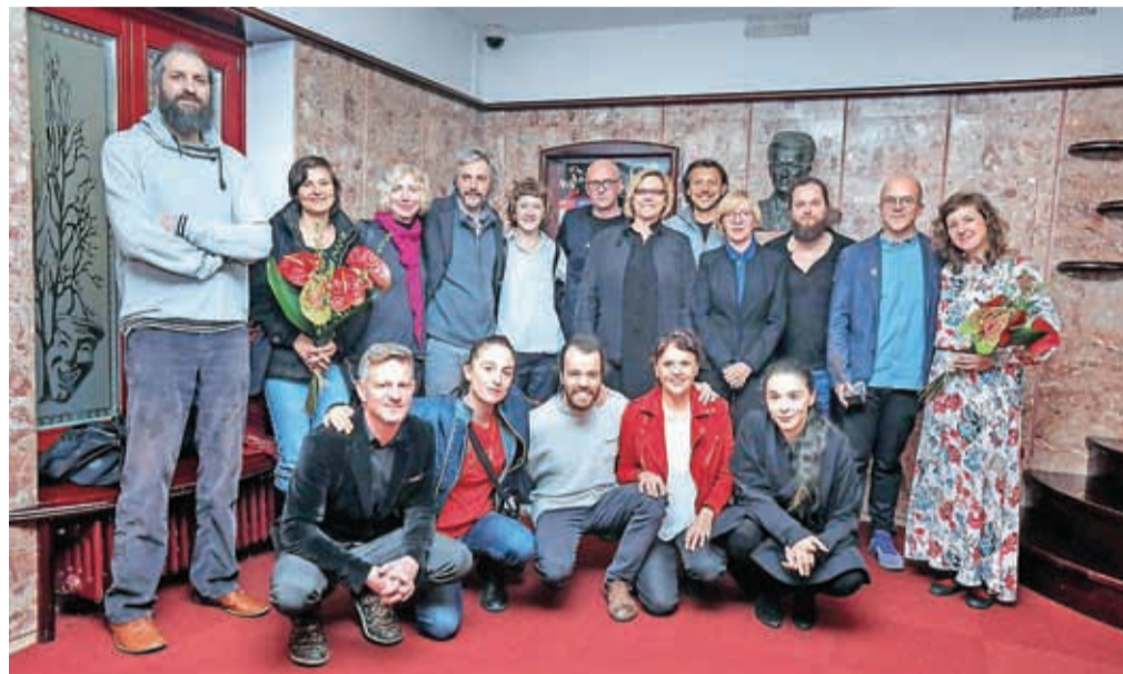
Skupinska fotografija nagrajencev letošnjega Tedna slovenske drame

Izjemna bera predstav zaznamovala 49. Teden slovenske drame.