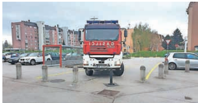
Urejanje intervencijskih poti pri večstanovanjskih zgradbah

Skupina je lani zaključila projekt intervencijskih poti na območju Klanca v Kranju. V letu 2019 bodo obnovili intervencijske poti na območju Primskovega ter pripravili vse za obnovitev intervencijskih poti na območju Huj in Planine. V prihodnosti načrtujejo obnovo intervencijskih poti na ostalih območjih večstanovanjskih zgradb in javnih zavodov, so še sporočili iz Mestne uprave Kranj.