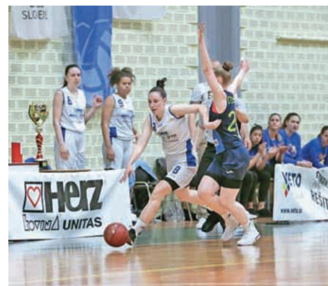
Košarkarice članske ekipe Triglava so v finalu morale priznati premoč Celjank.