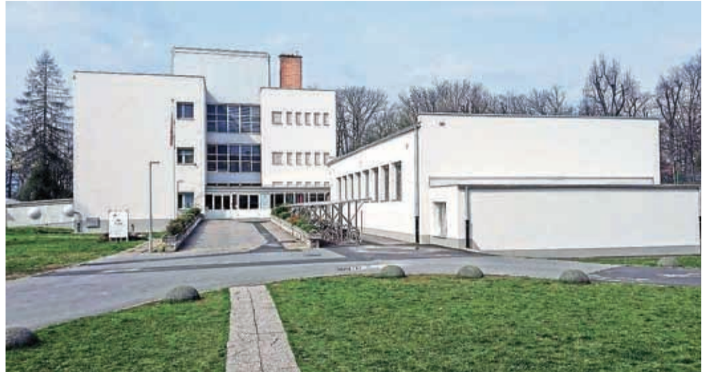
Energetsko prenovljena OŠ Staneta Žagarja

Kranj – Prek projekta, ki ga sofinancira Ministrstvo za infrastrukturo iz programa Evropske kohezijske politike, bo obnovljenih ali delno prenovljenih 22 objektov. Skupna vrednost obnov pa znaša 6,2 milijona evrov brez DDV, pri čemer bodo zasebni partnerji (konzorcij družb Petrol, Domplan in Gorenjske elektrarne) investirali 3,1 milijona evrov, 2,25 milijona evrov predstavljajo nepovratna evropska kohezijska sredstva, delež mestne občine pa znaša 0,83 milijona evrov. V celovite energetske sanacije so vključene občinska stavba in stavbe Prešernovega