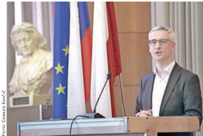
Minister Jernej Pikalo na posvetu na kranjski občini

"Na prvem delovnem srečanju smo predvsem 'dali probleme na mizo', je po srečanju poudaril minister in dodal, da so ugotovili, da je kar nekaj skupnih stvari, od nepremičninskih do drugih, ki jih lahko začnejo hitro reševati. "In jih tudi moramo, saj je objekt v ožjem središču Kranja, ki je v lasti ministrstva, v zelo slabem stanju in ga je treba hitro sanirati." Zgolj svetovalno vlogo pa bo imelo ministrstvo pri reševanju prostorske stiske vrtca v Bitnjah, kjer občina računa predvsem na pomoč pri