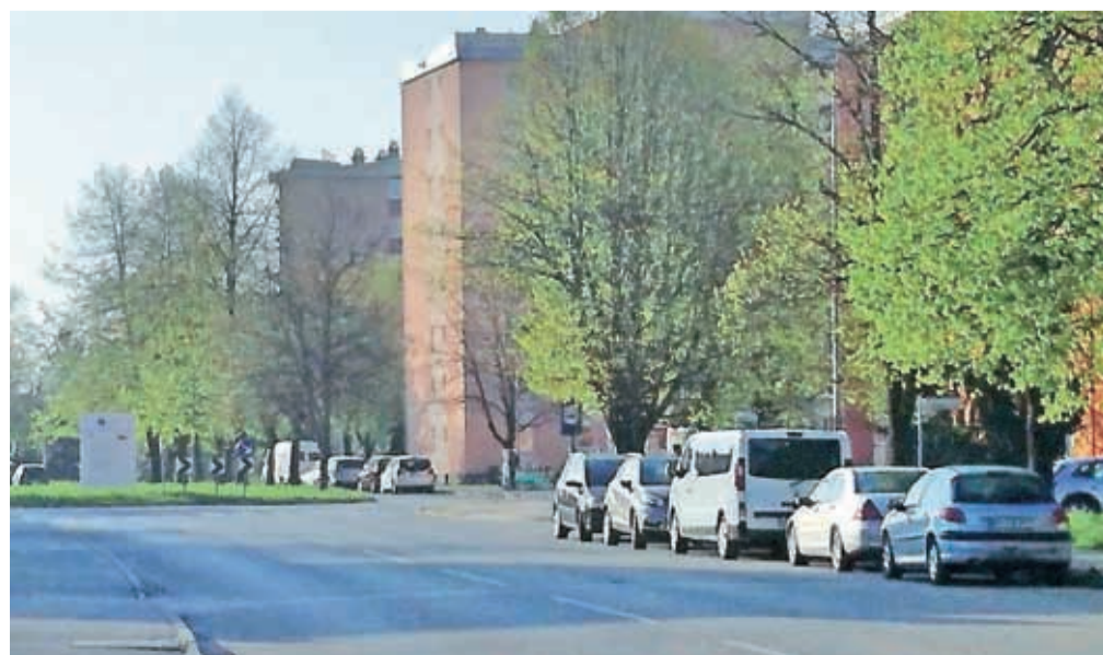
Bočno parkiranje na Planini

Na novi spletni strani bodo vsebine prilagojene kolesarjem, obiskovalci bodo lahko spremljali potek gradnje novih kolesarskih povezav, kot zatrjujejo v mestni upravi, pa bodo lahko vsebine prispevali tudi kolesarji sami. Novo konstituirana Komisija varno kolesarim, ki bo skupaj z mestno upravo vsebinsko upravljala stran, se bo tako opredelila do vseh zaznanih črnih točk na kolesarskih poteh v Kranju in okolici, uredniki pa vabijo tudi vse organizatorje dogodkov za kolesarje in vse, ki bi želeli prispevati svoj predlog za varen kolesarski izlet.