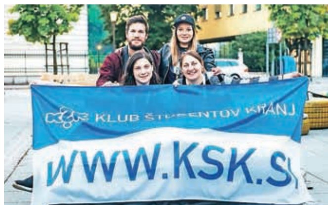
Mladinski festival, ki vsako leto znova poživlja kranjsko mestno jedro, organizirajo marljivi članice in člani Kluba študentov Kranj.

Kranj – Že petindvajseta izvedba festivala Teden mladih je kranjske ulice ponovno odela v barve mladostne energije. Zvrstili so se zanimivi športni, mladinski, kulturni, glasbeni, izobraževalni, otroški ter mednarodni dogodki. Na Slovenskem trgu je bila vse dni postavljena Hengalnica, baza festivala, prostor za sproščeno druženje mladih, kjer so potekali tako športno-rekreativni dogodki kot tudi različne predstavitve, plesni večeri, večeri ob ognju z raznovrstnimi koncerti in igrami. Koncerti so dajali močan utrip celotnemu festivalu – od začetnega zasedbe Koala Voice do sklepne skupine S.A.R.S. Poleg koncertov pa je Teden mladih ponudil številne ostale dogodke in aktivnosti. Stalnica festivala pa je žal tudi kislo vreme – tudi tokrat so ledeni možje krojili potek festivalskih prireditev na prostem, vendar je organizatorjem iz Kluba študentov Kranj z obilo marljivosti ter kančkom improvizacije večino dogodkov uspelo spraviti pod streho.