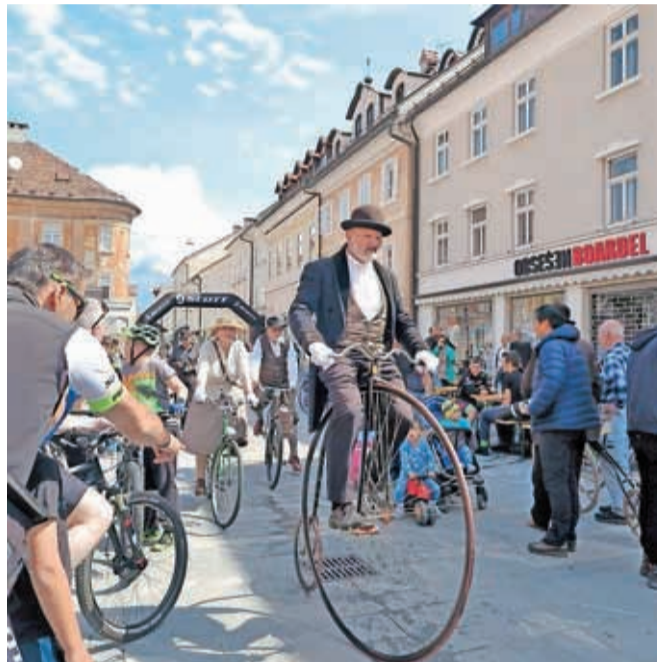
Predstavili so se starodobni kolesarji in kolesarske.