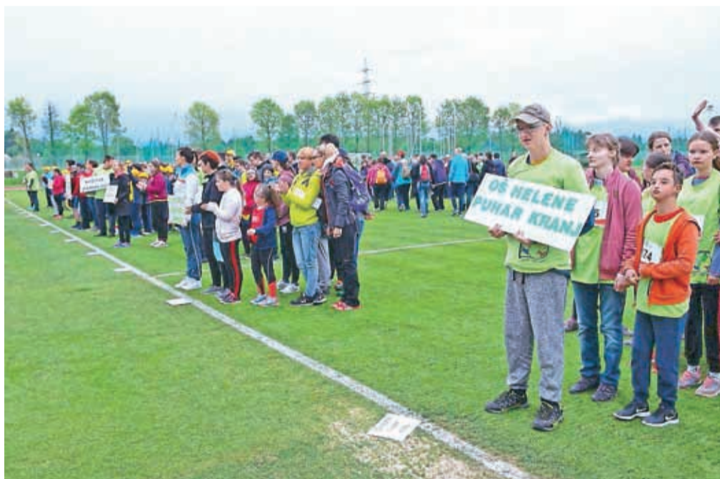
Najprej je bil zbor vseh udeležencev tekmovanja.