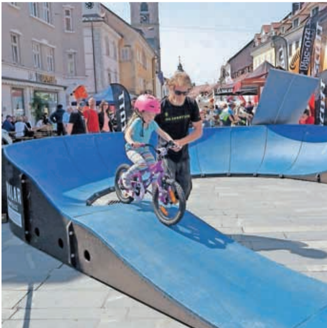
Najmlajši so uživali v vožnji na kolesarskem poligonu.

Že zgodaj dopoldne so v staro mestno jedro prišli številni, ki so se želeli preizkusiti na enem od treh maratonov ali pa poklepetati s prijatelji.