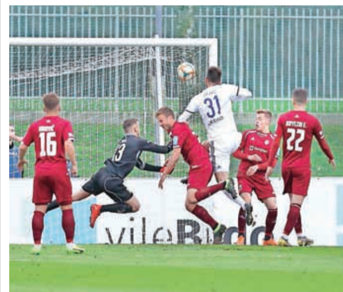
Nogometna ekipa Triglava, ki znajo presenetiti celo favorizirane nasprotnike, bodo tudi v novi sezoni igrali med prvoligaši.

uri s predstavitvijo najmlajših ter nadaljeval z nogometno revijo, ko bodo podelili tudi pokale, priznanja in nagrade posameznim klubskim selekcijam. Druženje se bo nadaljevalo ob nogometu ter zabavi. Sezona se končuje tudi z nogometne tretjeligaše. Ti so minuli konec tedna odigrali tekme predzadnjega kroga. Ekipa Save Kranj je v 3. SNL center gostovala pri Brinju Grosuplje ter z neodločenim izidom 3 : 3 osvojila novo točko. Ekipa Save Kranj bo tekmo zadnjega kroga odigrala jutri, 1. junija, ko bo v Športnem centru v Stražišču gostila nogometna Zagorja. Tekma se bo začela ob 16.30.