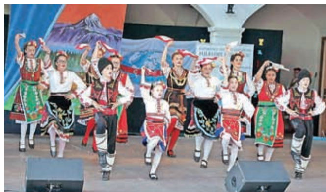
Na mednarodnem otroškem in mladinskem folklornem festivalu FOS Predoslje se je predstavilo sedemnajst skupin, med njimi tudi otroška skupina Gaytanche Dimitrograd iz Bolgarije (na fotografiji).

Folklorna skupina Iskraemeco Kranj je v sodelovanju z Javnim skladom Republike Slovenije za kulturne dejavnosti OI Kranj, Osnovno šolo Predoslje in Zvezo kulturnih društev Kranj organizirala že šestnajsti mednarodni otroški in mladinski folklorni festival FOS Predoslje, Kranj, tokrat pod geslom Kultura nas združuje. V dvodnevem programu, prvi dan so nastopili v Letnem gledališču Khislstein, drugi dan pa na Glavnem trgu pri vodnjaku v Kranju, je nastopilo sedemnajst skupin, med njimi tudi dve romunski in dve bolgarski skupini. »Osrednji namen festivala je spoznavanje in ohranjanje raznolikosti in bogastva tako naše kot tudi tuje kulturne dediščine. Skupine so predstavile svoje značilne plesne, glasbo, petje, narodne noše, šege in običaje iz okolja, od koder izhajajo,« je pojasnila predsednica FS Iskraemeco Kranj Marija Senk.