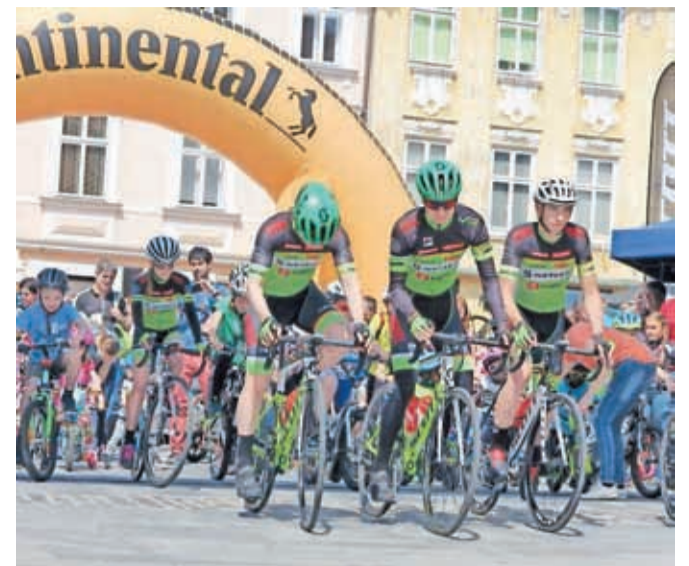
Treh kolesarskih maratonov so se udeležili tako tekmovalci kot otroci in družine.

Veliko zanimanje med otroki je bilo za spretnostni kolesarski poligon in poslikave obraza, prav posebno doživetje pa je bil nastop na maratonu, kjer je bil starter sedaj že nekdanji smučarski skakalec Robert Kranjec, ki je prav tako navdušen kolesar. Seveda na prireditvi niso manjkali domači kolesarski asi, prav tako navdušeno pa so obiskovalci pozdravljali starodobne kolesarje. Mnogim je bil izziv preizkusiti kolesa Scott, zlasti električna, ki so postala pravi hit.