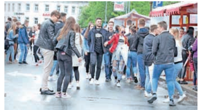
Maturantje gorenjskih šol so na Koroški cesti zaplesali četvorko.