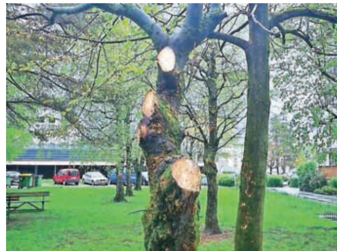
Na fotografiji je primer nepravilno obrezanih dreves.

Kranj – Mestna uprava Kranj je zaradi nepravilnega obrezovanja dreves v soseski Vodovodni stolp proti za zdaj neznanemu izvajalcu vložila prijavo na Policijsko upravo Kranj. Drevesa, ki so v lasti Mestne občine Kranj in za katera v okviru pristojnega odloka skrbi koncesionar, podjetje Flora sport, so bila s strani neznanega izvajalca nestrokovno obžagana, najverjetneje med 18. in 23. aprilom, pri čemer so bila tudi poškodovana. Prebivalce pozivajo, da sami ne izvajajo obrezovanja dreves, saj z nepooblaščenim posegom povzročajo veliko škodo ne samo drevesu, pač pa tudi okolju. Morebitne predloge o ozelenitvi Kranja in okolice lahko prebivalci mestni upravi sporočajo preko spletne aplikacije KRpovej.