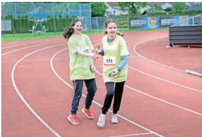
Tekmovalci so potekali v atletiki, elementih košarke in namiznem tenisu.