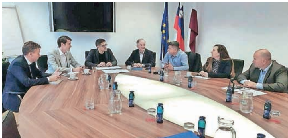
Šest županov je podpisalo poziv k zmanjšanju hrupa, namenjen pristojnim organom in institucijam.

hrup lahko izrazito zmanjšali z ukrepi, kot sta na primer vrnitev vzleta in pristajanja v koridor, ki se je uporabljala pred letom 2013, ter zmanjšanje preletov letal nad naselji v občini Vodice. Župani verjamejo, da bodo cilj dosegli s skupnimi močmi. »Za končni uspeh ozi-