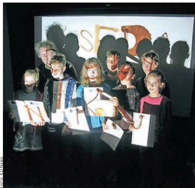
Ustvarjalna ekipa animiranega filma Beseda ni konj

Več si lahko preberete na spletni strani Ljudske univerze Kranj: https://www.luniverza.si/medgeneracijsko-sodelovanje s klikom na Program aktivnosti ali Zgibanka Kranj. Vabljeni.