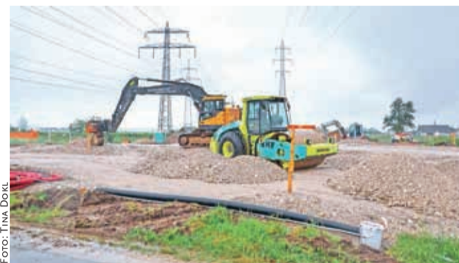
Gradbena dela v Bitnjah potekajo od konca aprila.

V Bitnjah se je gradnja novega krožišča začela prejšnji mesec, začenja pa se tudi prenova krožišča na Primskovem.