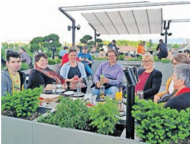
Dobrodelni dan je bil tudi priložnost za druženje.

V Panorami so namreč celodnevni izkupiček od prodaje izbranih pijač in dobrodelne