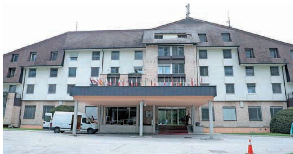
Hotel Brdo bodo do januarja leta 2021 temeljito prenovili.

vhodom spoznali delo mobilne enote, v pritličju urada so predstavili aplikacijo eDavki, klicni center in tudi to, kakšno pomoč Furs nudi na spletni strani. Obiskovalce so opozarjali tudi na pasti spletnega nakupovanja. Del svojega vsakdana je zbranim razkril tudi deskar Žan Košir, ki je za zdaj kot vrhunski športnik na Fursu zaposlen zgolj formalno, po končani karieri pa bo morda našel izziv prav v katerem od poklicev finančne uprave.