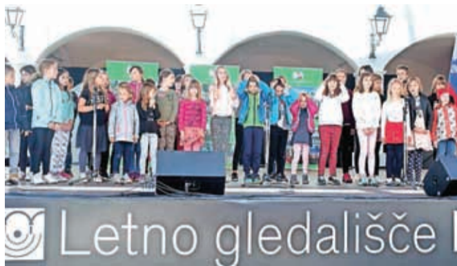
V letnem gledališču Khislstein se je odvijal 18. Frankofonski festival.