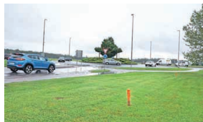
Začenjajo se tudi dela na Primskovem.

reditev klasičnega krožnega križišča v krožno križišče s spiralnim potekom. Pogodbena vrednost del je 1.145.778 evrov. Promet bo predvidoma oviran do konca oktobra. V prvi fazi dela potekajo izven vozišča. Vzpostavljena bo delna zapora z zožanjem voznih pasov na vseh priključnih krakih krožnega križišča. V območju križišča bodo zaprte vse površine za pešce in kolesarje. Obvozna pot bo potekala po cestah Rudija Šeliga in Jaka Platiše.