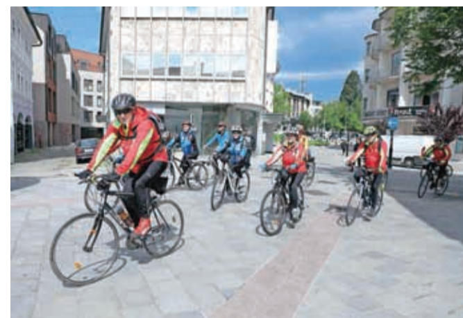
Srečanje kolesarjev v Kranju

"Kolesarjenje nam pomeni druženje, rekreacijo in posledično dobro počutje," je še povedal Ivan Strupi.