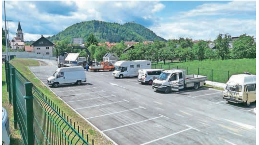
Na spodnjem platuju parkirišča Huje so možni mesečni in letni parkirni abonmaji.

Parkirnine uporabniki lahko poravnajo z gotovino (kovanci), s parkirno kartico Mestne občine Kranj ali mobilnimi telefoni. Mestne parkirne kartice so naprodaj v Mestni upravi Kranj, na avtomatu pred stavbo Mestne uprave Kranj in v Zavodu za turizem in kulturo (Turistično informacijski center) na Glavnem trgu 2 v starem Kranju. Cena kartice je osem evrov (veljavnost kartice je eno leto od prve uporabe na parkomatu). Na parkirišču Sejmišče so možni tudi parkirni abon-