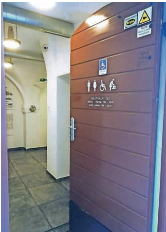
Javno stranišče v Kranju je označeno tudi z evro ključavnico.

Vgradnja evro ključavnic je priporočljiva v vseh javnih objektih (občine, pošte, zdravstveni domovi, šole, fakultete, muzeji, avtomobilska postajališča, bencinske črpalke, nakupovalni centri, železniške in avtobusne postaje) in invalidskih napravah (dvigala, dvizne ploščadi). Te ključavnice dajejo vrsto prednosti, in sicer je lažje čiščenje in zagotavljanje higijene prostorov, odpiralni čas je neomejen, omogočen je dostop gibalno oviranim, ni zlorabe prostorov, dolgoročno je to boljše oprema za lastnika in tudi zaščita je večja.