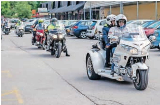
Paraplegiki so uživali v zanimivi vožnji.