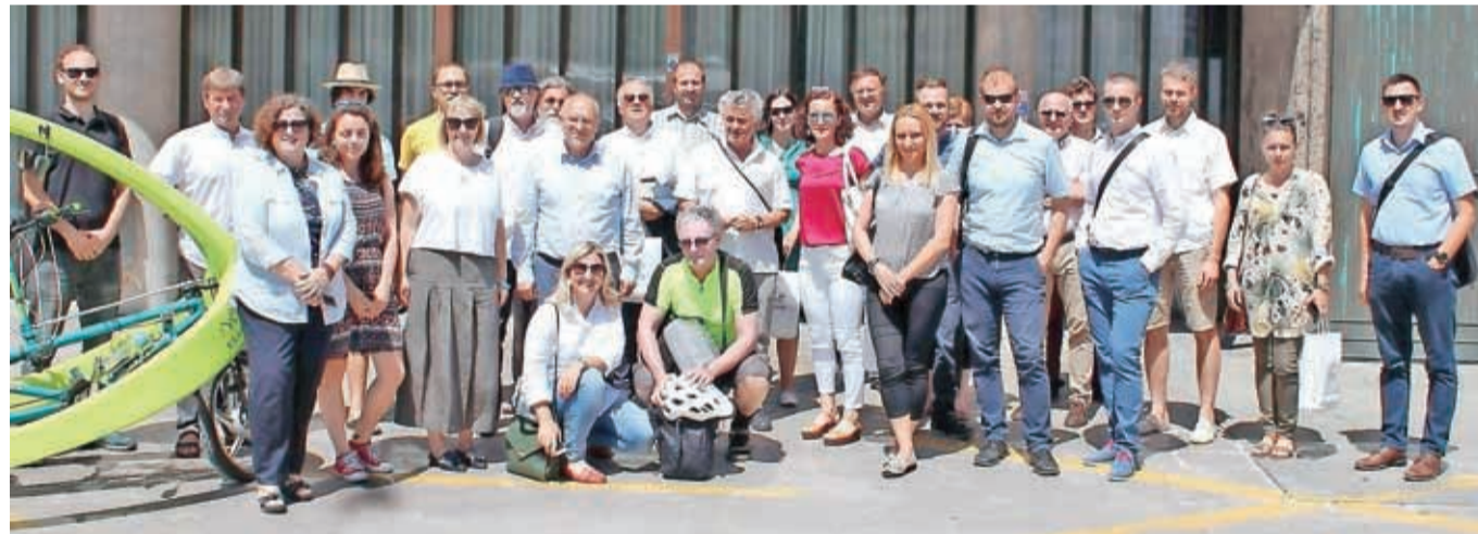
Letošnji Civinet forum je v Kranju gostil štirideset udeležencev iz držav nekdanje skupne države.

parkirnih mest za avtomobile v dobro kolesarjem, e-vozilom in sistemu delitve e-vozil AvanzGO ter spoznali, kako delujeta sistem KRskOLE-SOM in Kranvaj. Srečanje se je zaključilo s kosilom v starem Kranju, kjer so jim postregli s kranjskim triom – klobaso, štruklji in pijačo.