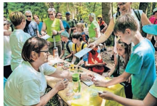
Med potjo po mamutovi deželi so pohodnike čakale tudi kontrolne točke in okrepčevalnice.

Kokrica pri Kranju – Več kot dvesto pohodnikov, ki so se jim pridružili tudi učenci podružnične šole na Kokrici, se je v začetku junija udeležilo dvanajstega Pohoda po mamutovi deželi, ki ga je ob sodelovanju Zavoda za turizem in kulturo Kranj že tradicionalno organiziralo Turistično društvo Kokrica. Kot je že običaj, so se lahko podali po štirinajst- ali sedemkilometrski poti mimo Bobovških jezerc, kjer so leta 1953 pri izkopu glin naleteli na okostje mamuta, po katerem je rekreativna prireditev tudi dobila ime, in po krajinskem parku Udin boršt. Na koncu poti pred supermarketom Mercator na Kokrici je sledilo družabno srečanje, na katerem so podelili tudi priznanja tistim, ki so se po Mamutovi poti podali že petkrat in desetkrat.