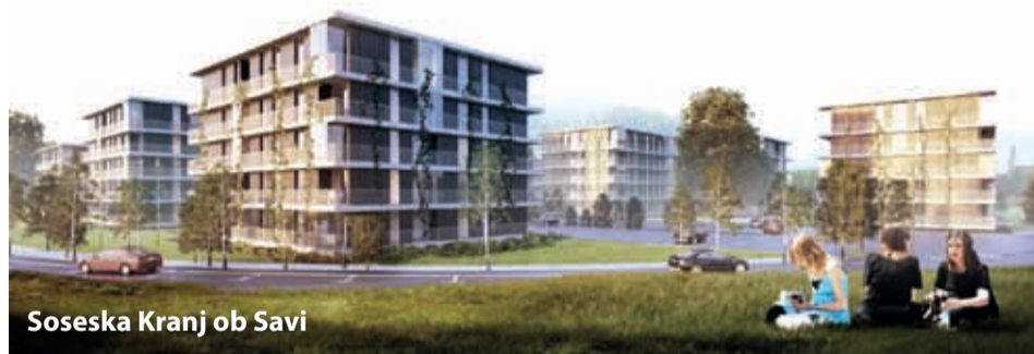
Soseska Kranj ob Savi

V preteklem mandatu nam je uspelo zagovati pravi prepoved našega Kranja, moto »za lepšo prihodnost« pa ostaja še vedno aktualen. In za mlade aktivne generacije so projekti, kot je gradnja novih stanovanj, izrednega pomena.