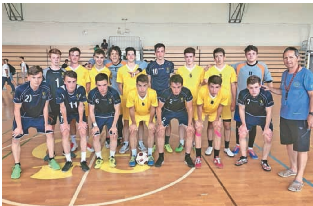
Gimnazijci so se pomerili na košarkarskem parketu.

čimi in lepimi akcijami. Sproščeno vzdušje, podkrepjeno z glasbo, svežim sadjem in osvežilnimi pijačami ter velikim številom navijačev, je prepričalo, da je dogodek dobrodošel in ga bodo naslednje leto zopet vpisali v koledar.