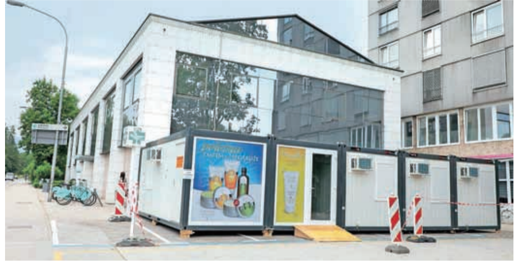
Lekarniško dejavnost na lokaciji centralne lekarne v Kranju (razen dežurstva) izvajajo v začasnih bivalnih enotah, ki so nameščene na parkirišču pred lekarno.

Zaradi večje prenove Lekarne Kranj je tudi lekarniška dežurna služba za čas do predvidoma 14. oktobra 2019 namesto na tej lokaciji v Kranju organizirana v Lekarni Škofja Loka na Stari cesti 10 (Zdravstveni dom Škofja Loka); telefonska številka dežurne lekarne je 04 511 16 80. Zakaj dežurna služba ni organizirana za ta čas na kakšni drugi lokaciji Gorenjskih lekarn v Kranju, pojasnjuje direktorica Gorenjskih lekarn Romana