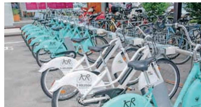
Nova postaja sistema KRsKOLESOM je sedaj tudi na železniški postaji.