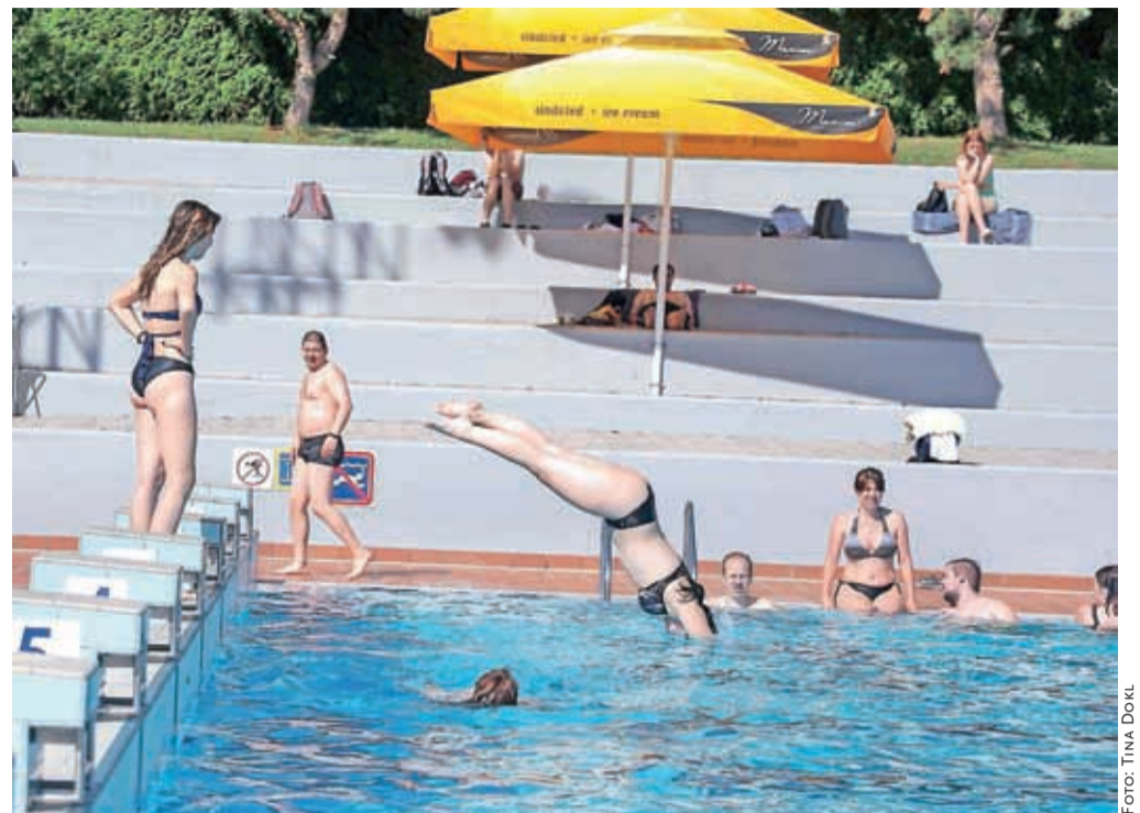
Letošnja kopalna sezona na kranjskem letnem kopališču se je začela prejšnji četrtek.

gram vodnega rekreativnega plavanja, ki je namenjen odraslim," pravi vodja športnih programov na Zavodu za šport Kranj Matija Bežek. Počitniške animacije v velikem bazenu potekajo ob ponedeljkih, sredah in petkih, v malem pa ob torkih in nedeljah, vse dni med 16. in 18. uro. Program je prilagojen številu in starosti otrok,