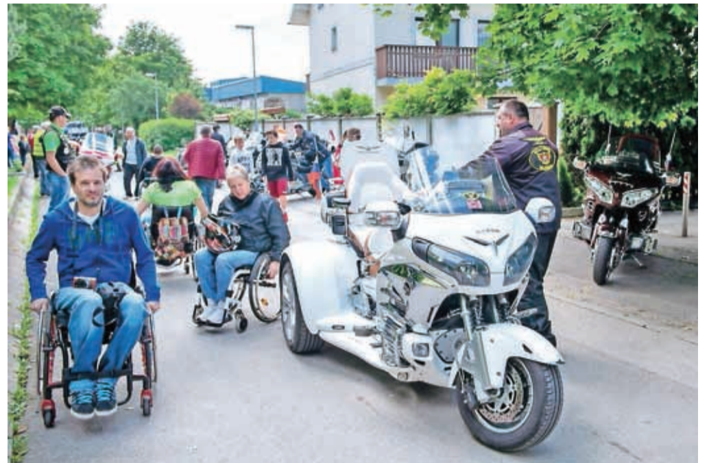
Delegacija motoristov s sopotniki paraplegiki se je iz Kranja podala na Jezersko in se vrnila na zbirno mesto pri sedežu Društva paraplegikov Gorenjske.

»Paraplegiki imate danes možnost, da zamenjate