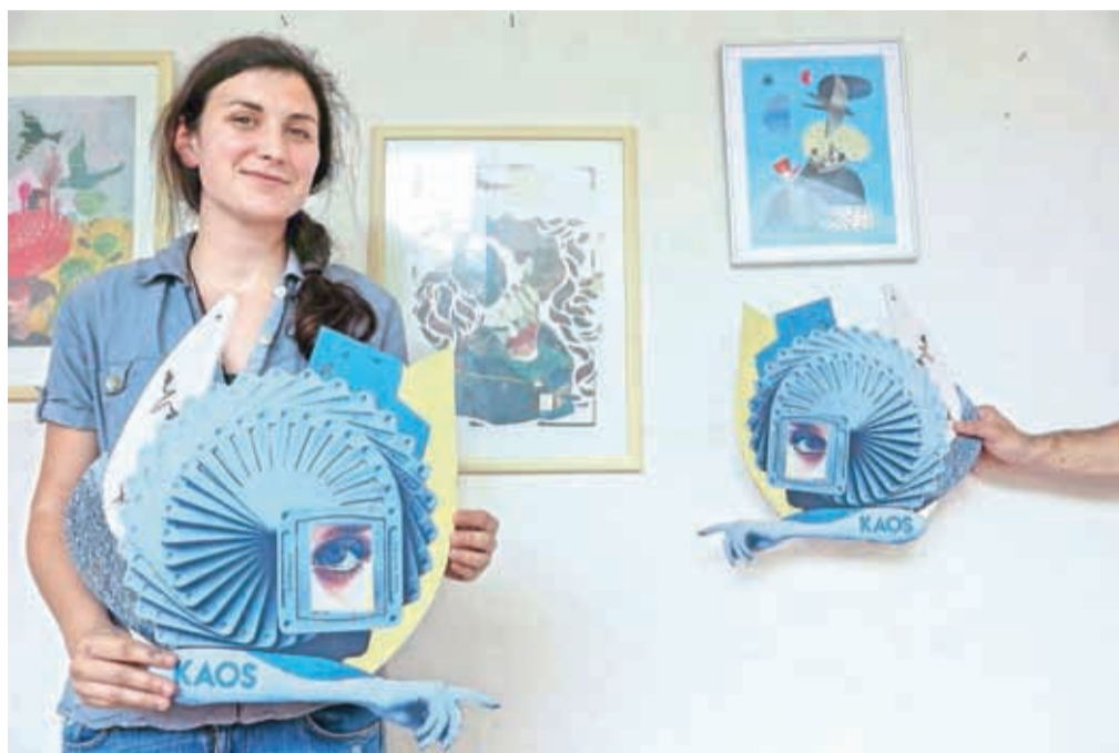
Maruša, kje je Miha?, fotografija, 2019

Galerija Layerjeve hiše bo tokrat gostila dela šestih rezidenčnih umetnikov, ki jih je izbrala kuratorica Petra Čeh. Dva izmed njih bosta ustvarjala mural, štirje pa bodo v skupnem projektu ustvarili stensko poslikavo na Mergentalerjevi hiši. Murala bosta nastajala na dolgi steni Trainstationa (Bill Noir) in na zidu na Poštni ulici 3a, ki se je nekoč držala Podrtine. (Susane Blasco). "Uspelo