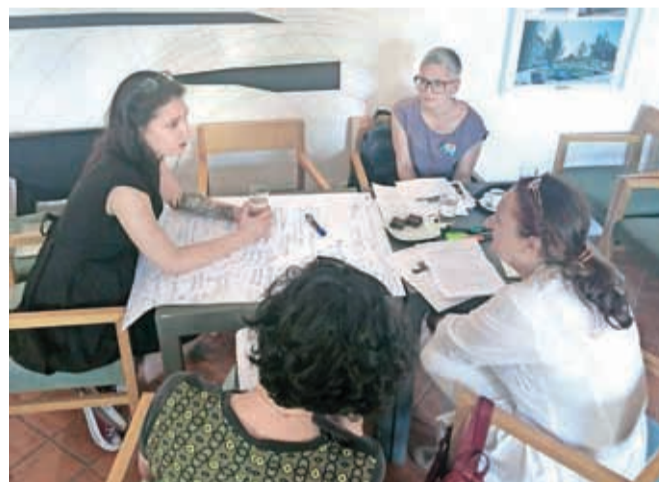
Utrinek z delavnice o kulturnih rezidencah