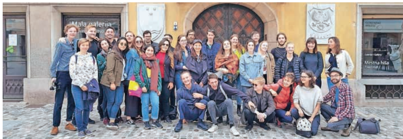
Kranj so obiskali podiplomski študenti iz vseh koncev sveta, ki študirajo na dunajski univerzi.

spreminjajoče se prostorske identite s poudarkom na različnih pristopih v treh postsocialističnih evropskih mest: Bratislavi, Ljubljani in Kranju.