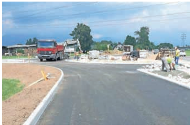
Dela v krožišču Bitnje potekajo po načrtih.

Zgornje Bitnje – Dela na krožišču Bitnje potekajo po načrtih izvajalca. Trenutno promet poteka po že zgrajenem delu krožišča in je urejen s semaforji, v času jutranje in popoldanske konice pa se zaradi boljše pretočnosti promet ureja ročno. Kot smo že poročali, je vrednost del 543 tisoč evrov. Od tega 503.637 evrov prispeva Direkcija RS za infrastrukturo, 39.371 evrov pa Mestna občina Kranj. Rok za dokončanje del je sredi letošnjega septembra. Poleg cestišča bosta urejeni tudi meteorna kanalizacija in javna razsvetljava.