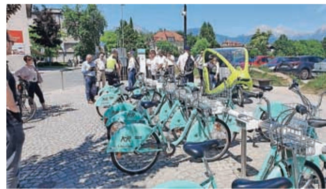
Udeleženci so se seznanili, kako deluje sistem izposoje koles, sedli v e-rikšo ...

V zanimivi panelni razpravi so udeleženci izmenjevali različne in obenem enotne poglede na trnovo pot izvajanja sprememb naših potovalnih navad.