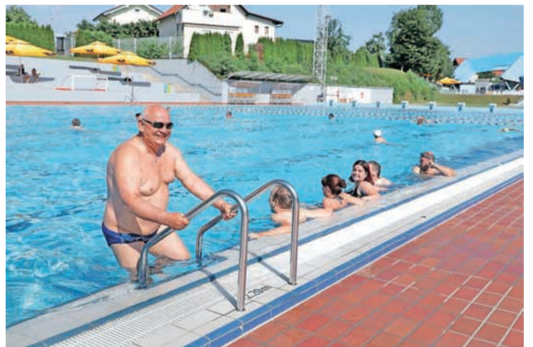
Prijetne temperature vode te dni vabijo kopalce, med katerimi je veliko tudi rednih obiskovalcev.