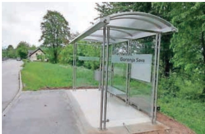
Nov nadstrešek je tudi na Gorenji Savi.

Kranj – Mestna občina Kranj je v okviru projekta Avtobusne nadstrešnice in kolesarnice na avtobusnih postajah postavila novo urbano opremo na osmih lokacijah v Kranju. Nove kolesarnice so postavljene na lokacijah Labore, in sicer v smeri Ljubljane, pri cerkvi na Drulovki (v smeri Kranja) in pri Osnovni šoli Staneta Žagarja v smeri Hrastij. Nadstreški oziroma čakalnice pa so odslej na lokacijah Gorenja Sava v obe smeri, pri Delavskem domu v Stražišču, pri trgovini v smeri Medvod na Drulovki, v Čirčah pri Tonaču v smeri Hrastja in na glavni Avtobusni postaji Kranj na peronih 1 in 10. Na vseh lokacijah rekonstruiranih avtobusnih postaj so na pločniku urejene tudi taktilne oznake za slepe in slabovidne, na vsaki izmed lokacij je bilo na novo zasajeno tudi po eno drevo. Skupna vrednost del je nekaj manj kot 170 tisoč evrov, predvidena vrednost nepovratnih sredstev Kohezijskega sklada pa znaša 115 tisoč evrov. Naložbo sofinancirata Evropska unija iz Kohezijskega sklada in Republika Slovenija.