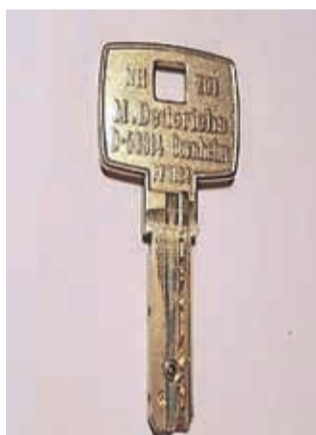
E-ključ je moč naročiti in ga uporabljati povsod po Evropi.

Kranj – Pobudo za evro ključavnico je dalo Društvo paraplegikov Gorenjske. Tako so toaletni prostori s posebnim evro ključem dostopni 24 ur dnevno, vse dni v letu. To je še posebej pomembno za ljudi, ki so kakorkoli gibalno ovirani, za slepe in slabovidne, diabetike, stomatološke bolnike in bolnike z multiplo sklerozo ter kroničnimi boleznimi mehurja in črevesja.