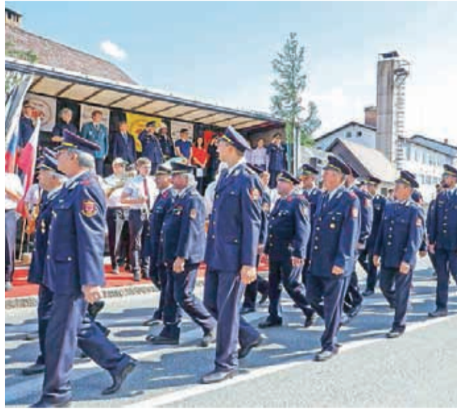
Začetki gasilstva na Primskovem segajo v leto 1879, ko so mestni veljaki ustanovili prostovoljno enoto Požarne brambe Kranj.

"Gasilci Prostovoljnega gasilskega društva Kranj Primskovo ste tako kot slovenski gasilci nasploh pomembno prispevali k utrjevanju slovenske narodne identitete, pa tudi aktivno delovali na naši poti do samostojne in suverene države. Ste ključni steber v slovenskem sistemu varstva pred naravnimi