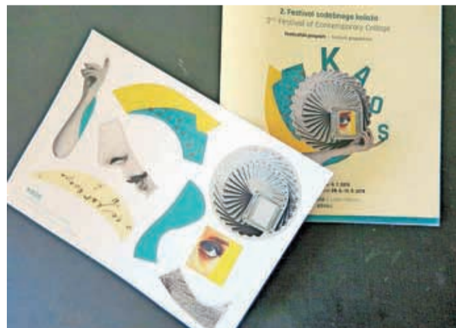
Sestavite si svoj lastni kolaž Kaos.