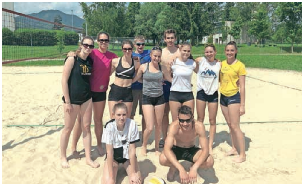
Vroče je bilo tudi na igrišču za odbojko na mivki.