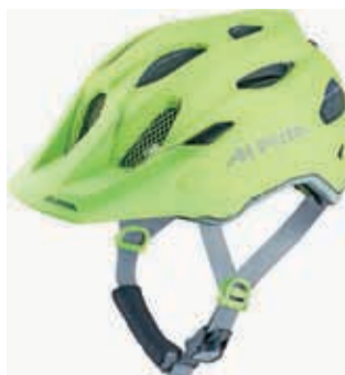
Čelada za varnost in vidnost

Njena uporaba je zelo priporočljiva tudi za ostale kolesarje. Ker se kolesarjem marsikdaj zgodi, da jih ujame tema, da vozijo v slabši svetlobi in so manj vidni, pa je pred kratkim prišla na tržišče novost. To pa so prav posebne čelade z LED-trakovi, ki se s pritiskom na gumb prižgejo. Dokazano pa je, da svetleča rumena barva na čeladi vidnost kolesarjev povečuje tudi čez dan.