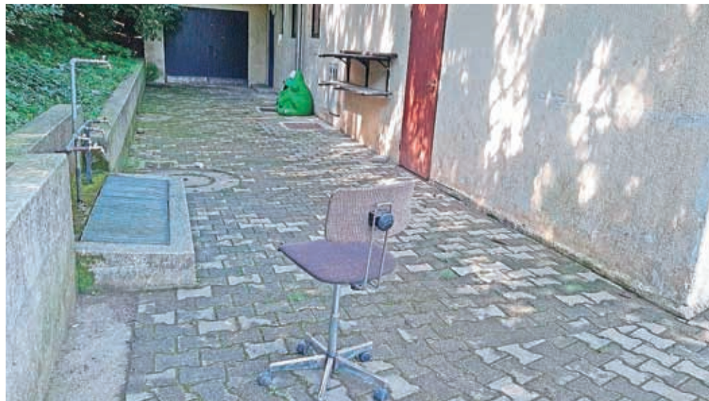
Slačilnice in pisarne ter nekdanji lokal v prvem nadstropju zob časa trdovratno uničuje.

Omejevanje hrupa oz. prepoved le-tega ureja 8. člen Zakona o varstvu javnega reda in miru, ki določa, da se kaznuje oseba, ki na nedovoljen način med 22.00 in 6.00 moti mir ali počitek ljudi s hrupom in pri tem ne gre za nujne interventno-vzdrževalne posege. Zakonodaja tako ne omejuje uporabe motornih kosilnic, brusilnic in podobno ob nedeljih in praznikih, seveda izven prej omenjenega termina, ki velja za vse dni v tednu. Za nadzor nad izvajanjem določbe 8. člena omenjenega zakona je pristojna Policija. Glede obratovanja pravne osebe, torej izvajanja obrti v času praznikov, pa vam žal ne moremo posredovati konkretnega pojasnila, saj to področje ne spada v pristojnost našega inšpektorata. Svetujemo vam, da se s tem vprašanjem obrnete na tržni inšpektorat. Na koncu naj omenimo še, da prekomeren hrup v bivalnem okolju ureja tudi sosedsko pravo, stvarnopravni zakonik pa določa, da mora lastnik svojo nepremičnino uporabljati tako, da drugim ne povzroča prekomerne škode oziroma kot je navedeno v zakonodaji, da ne povzroča prepovedanih emisij (tudi zvok). Svoje pravice si torej lahko zagotovite tudi s (civilno) pravnim postopkom (zasebno tožbo).