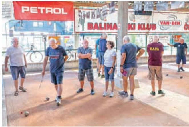
Ob jubileju so pripravili turnir.

Praznovanje pa ni bil le praznik balinarjev Čirč, saj se jim je pridružilo veliko kranjanov, balinarke pa so poskrbele za tradicionalni pasulj.