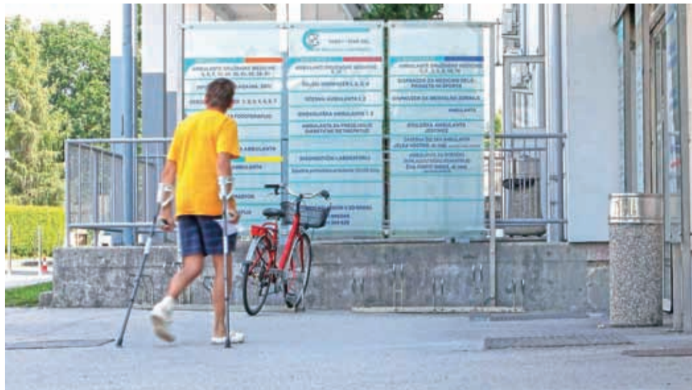
V ZD Kranj iščejo nove zdravnike, tudi s pomočjo agencije.

"Nekaj zdravnikov je odpovedi umaknilo, enajst jih odpovedi še ni preklicalo. Dva od tistih, ki so podali odpovedi, se bosta zaposlila polo-