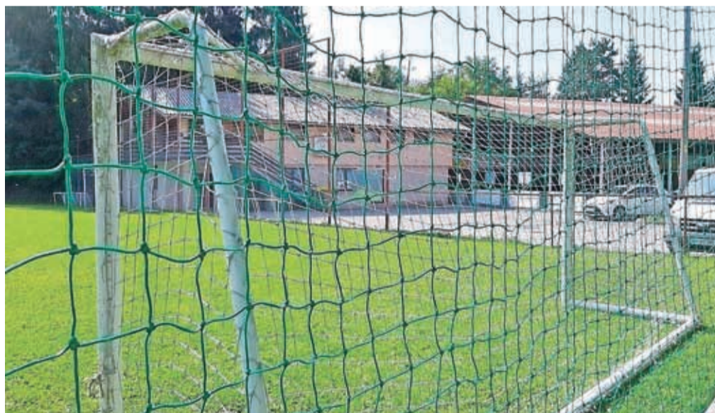
Nogometno igrišče je namenjeno vadbi najmlajših ...

A človeka zaboli srce, ko vidi objekt ob nogometnem igrišču propadati. Nekdaj je bil tam uspešen in resnično nemoteč gostinski lokal, kot popestritev, danes je stavba domala takšna kot ob izgradnji. Balinišče je daleč od nekdanjega vrveža, a nikakor ni zapuščeno. Dolga leta so trajale bitke, da so