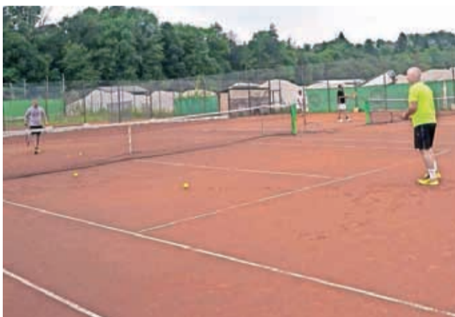
V Športnem parku Zarica je vedno živahno, zelo aktivni so tudi tenisači.