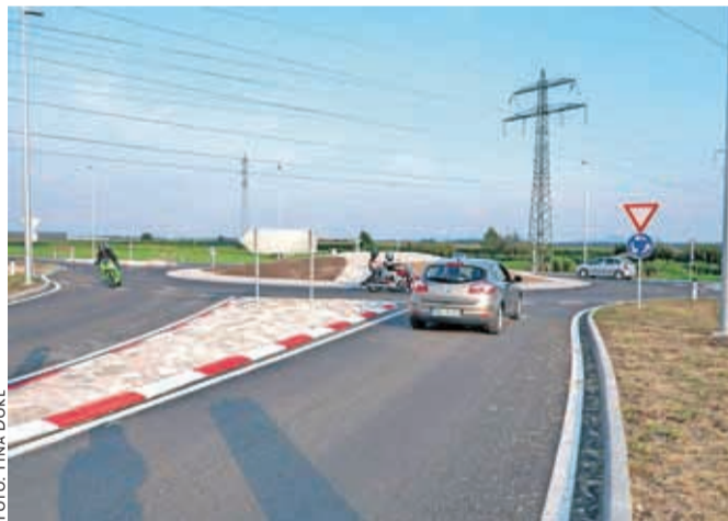
V Bitnjah ni več težav pri vključevanju na glavno cesto.

Menjave prometnih pasov znotraj tega krožišča niso dovoljene, prometni pasovi pa bodo tudi fizično ločeni z nizkimi betonskimi elementi," pojasnjuje višji samostojni policijski inšpektor in predstavnik za