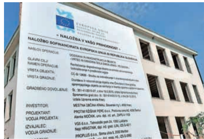
Prenavljajo šolsko stavbo ob Prešernovem gaju, kjer bo v prihodnje prostora za štiri oddelke vrtca in učilnice podružnice OŠ Simona Jenka.

dvajset otrok, malo manj na Trsteniku (9) in Mavčičah (17). Sicer pa je med osnovnimi šolami po številu najmanjša OŠ Helene Puhar s prilagojenim programom z 11 oddelki in 103 učenci v lanskem šolskem letu in 52 zaposlenimi. Največja je OŠ Simon Jenko, kjer bo tudi letos okoli 1200 otrok, zaposlenih pa je 147, OŠ Predoslje pa ima 19 oddelkov z okoli 450 učenci in zaposluje 65 ljudi. Številke še niso povsem natančne, ker bo ob začetku šolskega leta prihajalo še do manjših sprememb.