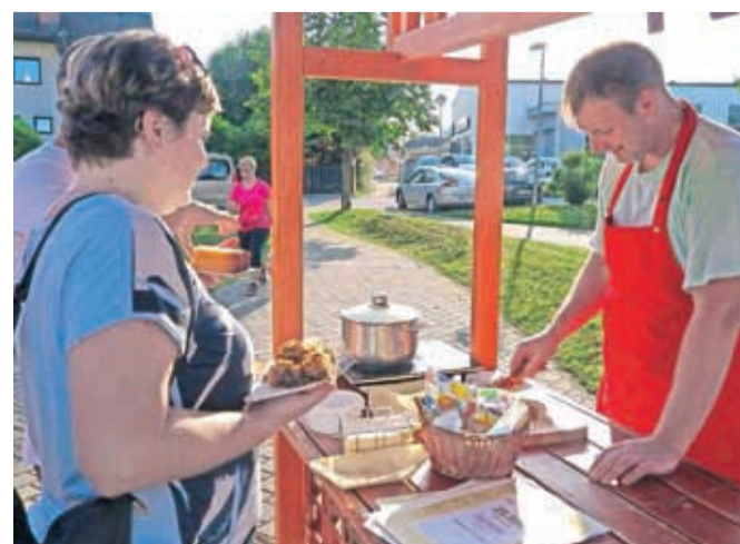
Obiskovalci z veseljem obiskujejo lične stojnice.

Stražišče – Navada domačinov iz Stražišča in okolice je, da se vsak drugi petek v mesecu srečujejo na domači tržnici na Baragovem trgu. Tako je bilo tudi julija in avgusta, ko je ponudbo popestril še festival piva z butičnimi domačimi pivovarji. Nič manj kot stojnice s pivom ter ponudbo domačih pridelkov pa ni bila obiskana stojnica kmetije Hribar iz Predoselj, na kateri je bilo močokusiti in kupiti njihove najboljše izdelke.