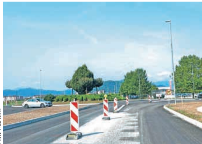
Prenovljeno krožišče na Primskovem bo bolj pretočno.

išče, ki je zagotovo najbolj obremenjeno v vsej občini, je treba povečati zaradi pretočnosti, dela pa naj bi bila končana oktobra. V Gorenjski gradbeni družbi ta konec tedna načrtujejo popolno zaporo krožišča zaradi asfaltiranja. Začela naj bi se jutri ob 5. uri zjutraj in trajala do nedelje, 1. septembra, do polnoči. Vsi kraki krožnega krožišča bodo zaprti do prvega sosednjega krožišča. V