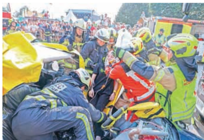
Prikaz reševalne vaje ob prometni nesreči avtobusa in osebnega vozila.