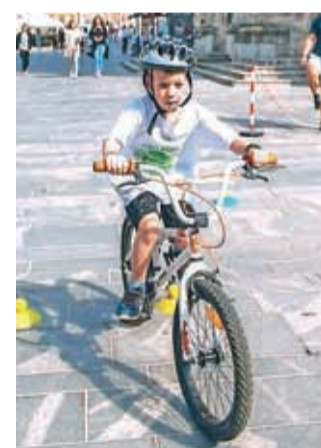
V središču Kranja bo moč spoznati različne športe. Fotografija je z lanske prireditve.

Prešernovim gledališčem. Na prireditvenem odru bodo potekali tudi praktični prikazi različnih športnih panog, na Glavnem trgu pa bo med 12. in 16. uro tudi tekmovanje v športnem plezanju, pripravili bomo Mini Planico in še marsikaj. Sicer pa bo sobotno dogajanje zgolj vrhunec festivala, ki se bo začel že v ponedeljek, 9. septembra, s predavanjem o dopingiu v športu," pojasnjuje Peranovič. Rdeča nit letošnjih predavanj je povezana z zdravjem, ponedeljkovo predavanje o dopingiu v športu pa je namenjeno predvsem trenerjem, športnikom in športnim delavcem. V torek bo sledilo zanimivo predavanje, ki je namenjeno tudi staršem, saj bo dr. Rudi Čajavec predaval na temo otrok in športa. O telesnih pripravah bo v sredo predaval dr. Primož Pori. Vsa predavanja bodo ob 19. uri v Galeriji Škrlovec. Ob predstavitvah športov je veliko programa namenjenega mladim. "V petek, 13. septembra, pripravljamo športni dan za tretji razred osnovnošolcev. Predstavili jim bomo kar dvanajst različnih športnih panog, v sodelovanju z Zavodom za turizem in kulturo pa bodo otroci iskali tudi zaklade in spoznavali mesto. Že v torek dopoldne priprav-