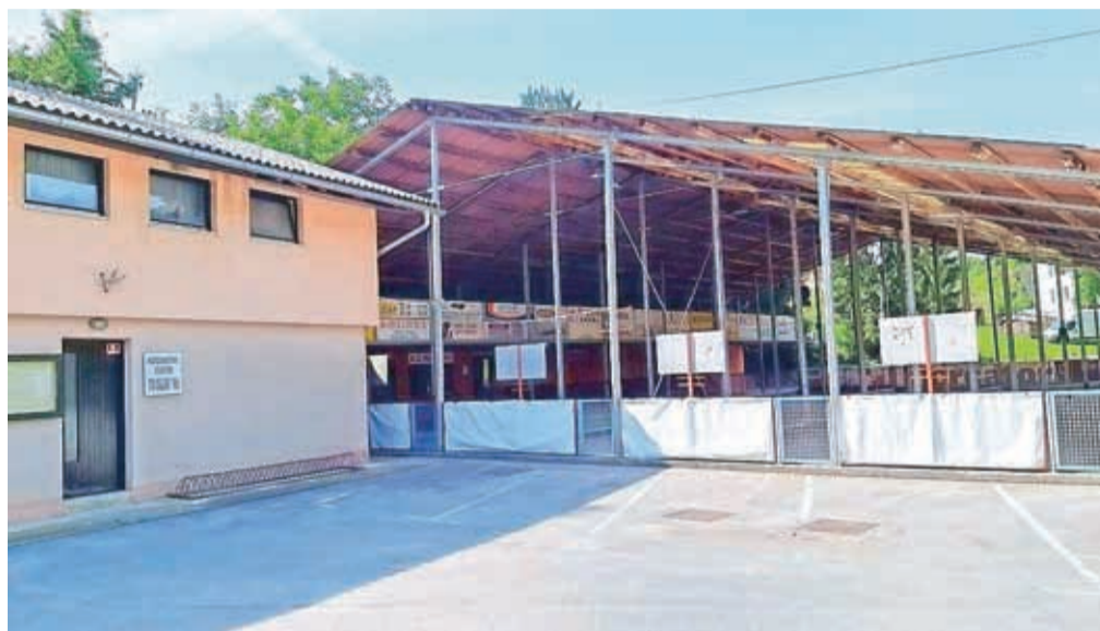
Ko je bilo zgrajeno, je bilo pokrito balinišče pravo "čudo" – daleč naokoli ni bilo enakega.

Danes sprehod ob Kokri ponuja dokaz, da ljudje nismo zmogli ohraniti truda predhodnikov. Nogometno igrišče je danes sicer namenjeno najmlajšim, kar je dobro.