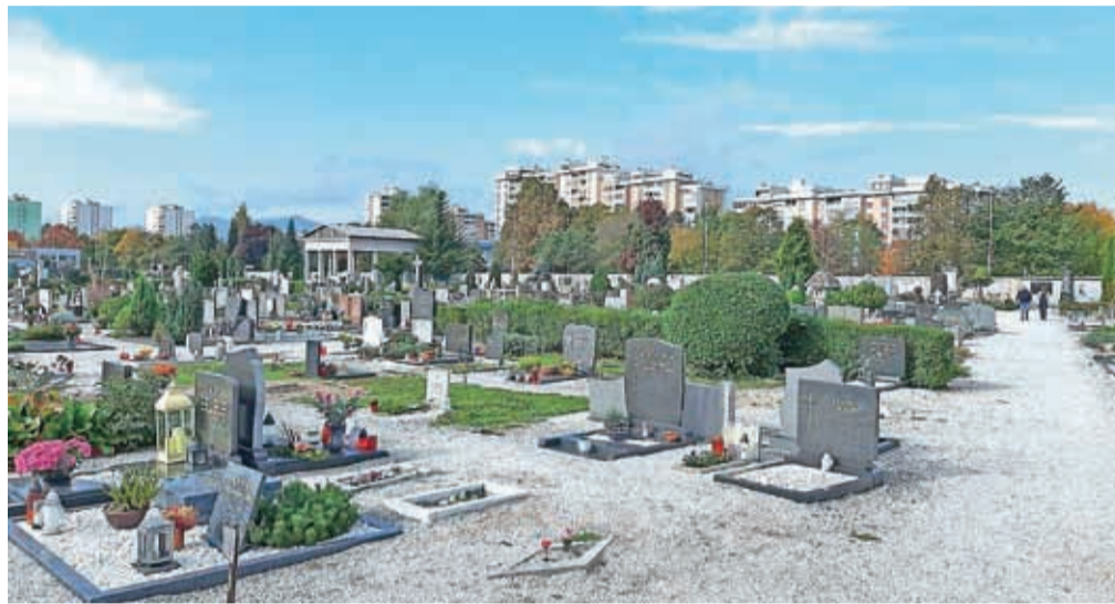
Mestno pokopališče Kranj ima natanko 5280 grobov.