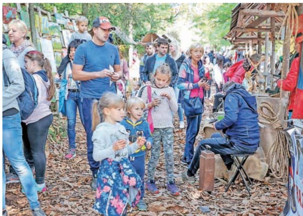
Za dobro počutje obiskovalcev Kostanovega piknika v Besnici je letos skrbelo okoli šestdeset prostovoljcev.

Na petdesetih stojnicah so se predstavili lokalni in gostujoči obrtniki, kranjski jamarji so za otroke pripravili spust po jeklenici oziroma zipline, v otroškem kotičku Osnovne šole Orehek Kranj pa so potekale zabavne in kreativne delavnice. Letos je organizator prvič poskrbel tudi za brezplačni vsakourni avtobusni prevoz iz Kranja do Besnice in nazaj.