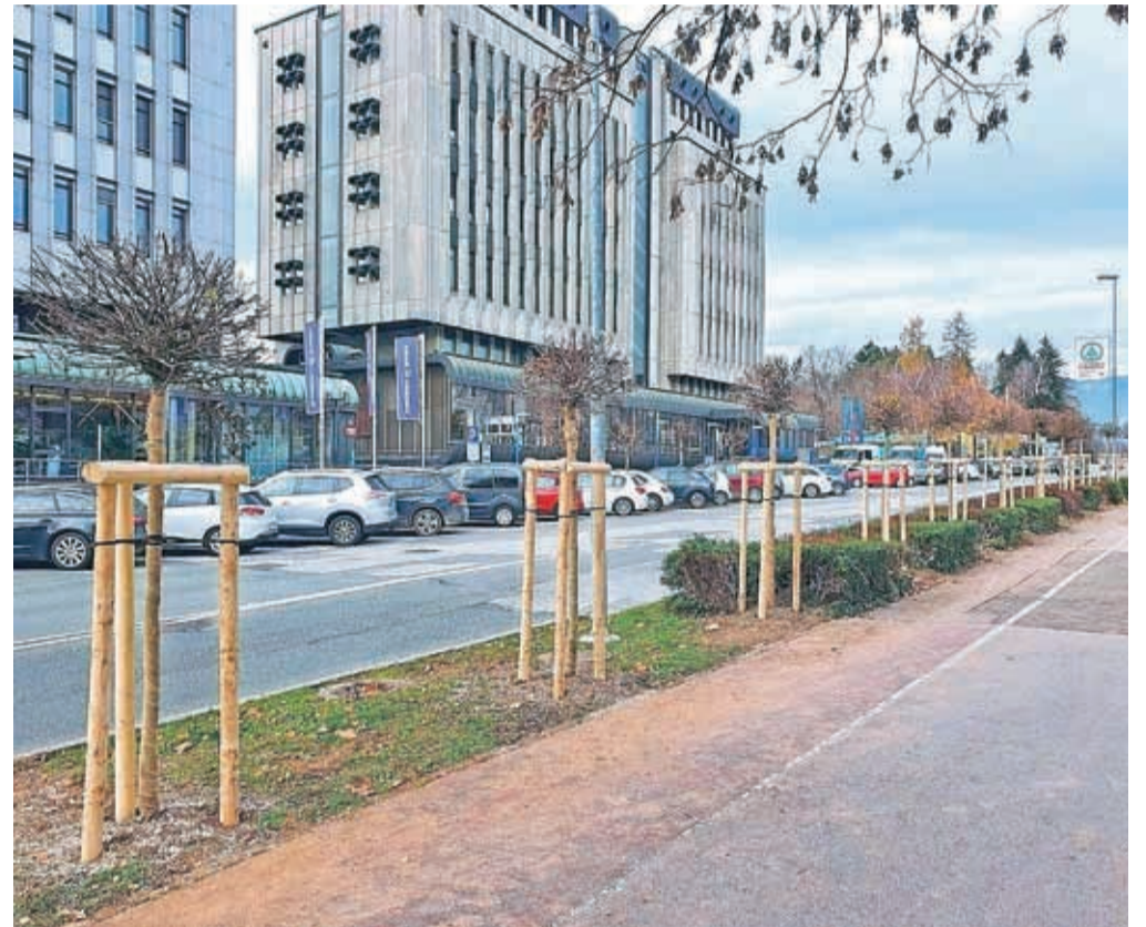
Nova zasaditev dreves ob Parku La Ciotat

Kroglasti javor ( Acer platanoides "Globosum") – 13 primerkov je bilo zasajenih sredi novembra ob Bleiweisovi cesti ob Parku La Ciotat – je priljubljeno mestno drevo z gosto zaprto krošnjo. Drevo zraste do višine šest metrov,