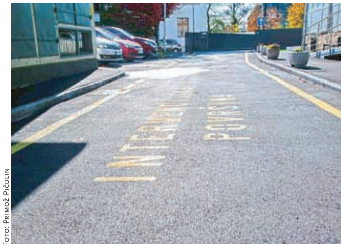
Ulica ob kranjskem nebotičniku je sedaj lepo urejena.

Stanovalci na to idejo niso mogli pristati, saj je zadnji vhod zanje zelo pomemben. Uporabljajo ga kot glavni vhod, saj imajo tam parkirišče in tam odlagajo smeti. Prav tako sta tam klančina za invalide in otroške vozičke ter nakladalna rampa. Zato so iskali vse možne rešitve, tako na Mestni občini Kranj kot v Krajevni skupnosti Vodovodni stolp in pri upravniku Domplanu Kranj.