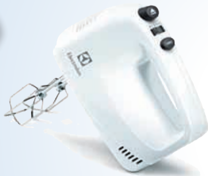
ročni mešalnik Electrolux