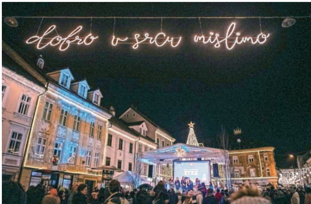
Tako kot lani tudi letos v predprazničnih dneh na županovo pobudo poteka humanitarna akcija V Kranju v srcu dobro mislimo. / Foto: PRIMOŽ PIČULIN

Zgodbe, ki nemalokrat priključijo solze na naš obraz, niso enostavne, zato pomagajmo sosedu, krajanu ali prijatelju, ki nas še kako potrebuje. Pomagamo lahko s prispevkom na TRR Društva prijateljev mladine Kranj SI56 6100 0000 5487 540, odprt pri Delavski hranilnici, d. d., Ljubljana, s sklicem 500-21112020.