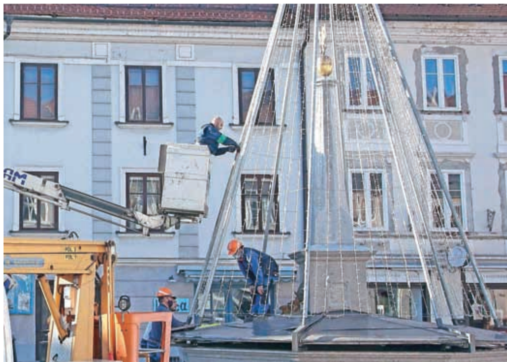
Kljub omejitvam bo v mestu tudi letos poskrbljeno za praznično podobo.