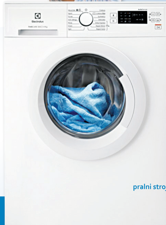
pralni stroj Electrolux