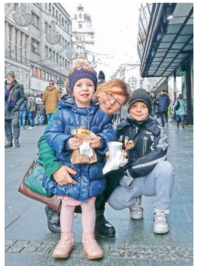
Z otrokoma

Odraščala sem v družbi živali. Moj oče je imel živalsko farmo in živali so bile vedno moji hišni ljubljenci. Najprej sem sploh želela postati veterinarica. Kasneje sem se premislila in se vpisala na študij medicine. Razmišljala sam – če bom znala zdraviti ljudi, bom znala pomagati tudi živalim. Biti zdravnik je zelo odgovorno delo in zahteva stalno učenje. Delo še posebej na primarnem nivoju zdravstva je pa še več kot samo zdravljenje. Dolga leta spremljaš in vodiš paciente in se razume, pa če to želiš ali ne, da se tudi bolje spoznavaš. Čez čas se vzpostavi zaupljiv odnos, a tudi pričakovanje. Deliti zdravstvene probleme in usode ljudi je včasih težko breme, vendar pa pogosto prinese lepe stvari, ker je delo z ljudmi predvsem izmenjava energije. Vse paciente si zapomnim in od vsakega sem se kaj tudi naučila.