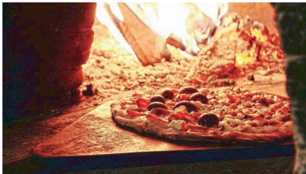
Veliko gostinskih ponudnikov se je odločilo, da po novem ponudi dostavo ali osebni prevzem hrane.

ogledate na spletni strani Mestne občine Kranj. Vsi kmetovalci, ki prihajate s tega območja in na seznam še niste uvrščeni, osnovne informacije o vaši kmetiji in ponudbi sporočite na barbara.ciric@kranj.si.