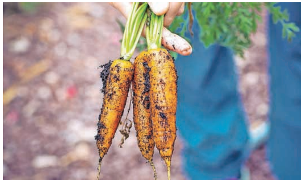
Zelo bogata je ponudba kranjskih pridelovalcev hrane.