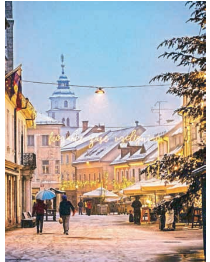
Rdeča nit izbrane in lične okrasitve so Prešernovi verzi.

ni december. Pripravljen je božično-novoletni sejem, ki naj bi odprl svoja vrata po 11. decembru, a ga bomo izpeljali le v primeru, da bo situacija to omogočala. Nekatere vsebine pač v decembru ne smejo manjkati, zato smo jih za vas pripravili v virtualnem svetu. Otroke bodo pozdravili in nagovorili trije dobri možje. In ne smemo pozabiti na socialno ogrožene soljudi, zato se bo tudi letos, tako kot lani, odvijala dobrodelna akcija V Kranju dobro v srcu mislimo. Ostanite dobrega in odprtega srca in sodelujte v virtualni dobrodelni akciji, če je to le v vaši moči. Virtualne vsebine boste lahko