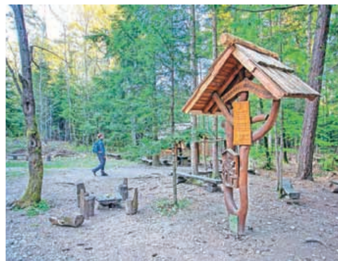
Po krajinskem parku je speljanih nešteto poti, ki vam omogočajo brezskrben skok v naravo.

Da po gozdni avanturi ne boste lačni, se ustavite še v eni izmed gostiln, ki se nahajajo v bližini in ponujajo hrano za s seboj. V Piceriji in gostilni Dežman lahko dobite izbrane domače jedi, postrvi in morske sadeže, pice iz krušne peči in jedi z žara. Brunarica Štern ponuja pice, morske jedi, domače in gorenjske specialitete, v Piceriji Orli pa lahko prevzmete pice iz testa, ki se vam kar stopi v ustih.