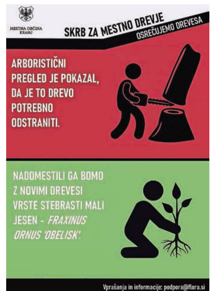
Označbe na Župančičevi ulici

V MOK odslej s posebnimi nalepkami označujejo drevesa, določena za posek. Na nalepkah bo tudi kontakt arborista, na katerega se občani lahko obrnejo v primeru, da bodo imeli vprašanja glede označenega drevesa.