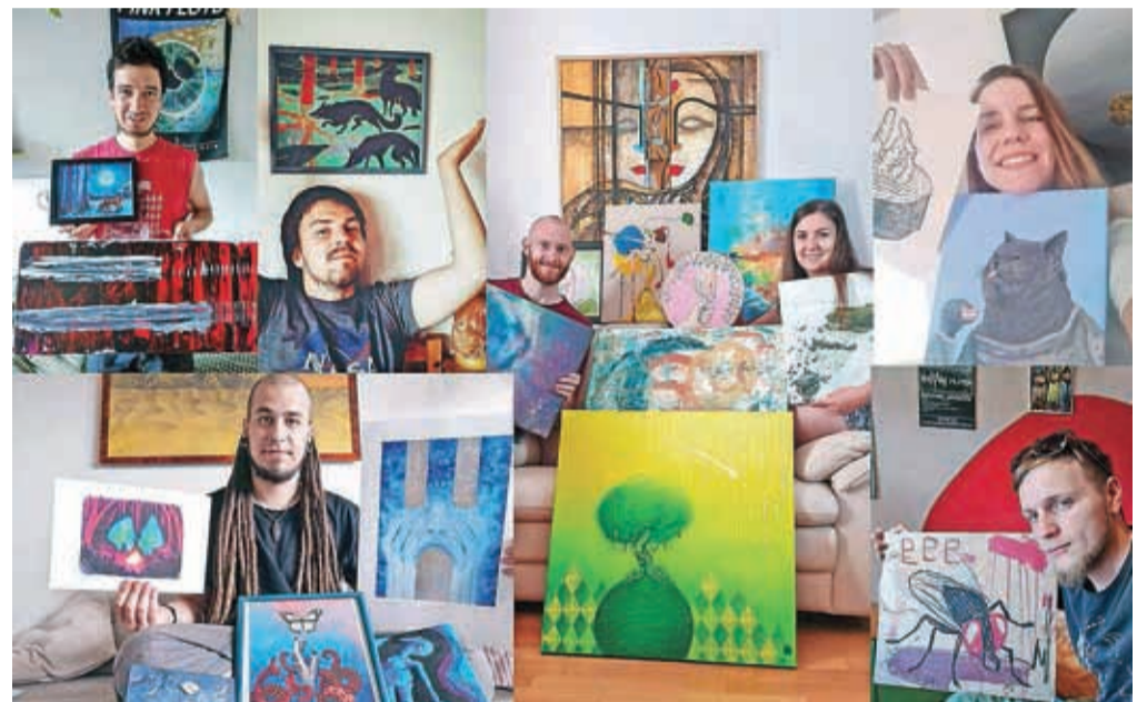
Pimp my Walls je dražba za lepše stene.

Organizacija spletne dražbe dekorativne umetnosti ni mačji kašelj, zato prostovoljci na teden porabijo približno šestdeset ur, da projekt teče tako, kot mora. V ponedeljek, 16. novembra, so po odlično sprejeti prvi sezoni dražb začeli že drugo. Letošnja novost sta dva tematsko obarvana tedna. Prvi, Človeško telo in erotika, je potekal med 23. in 27. novembrom. Dela na tematiko Družbena kritika in naravovarstvo pa bo možno licitirati med 7. in 11. decembrom. Zadnji teden umetniških dražb bo potekal od 14. do 18. decembra. Kako do svoje umetnine? Vsak ponedeljek ob 12. uri na Facebook profilu Pimp my Walls objavijo album z do sto slikami izdelkov in njihovimi izključnimi cena-