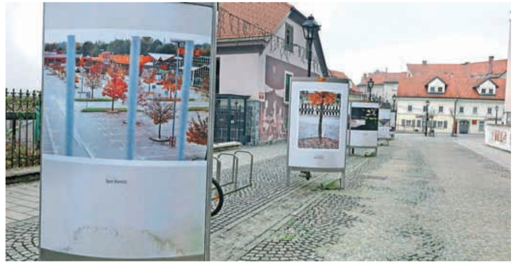
Razstava Majdičev log = savski otok nas popelje v preteklost in spregovori o sedanjosti tega dela mesta.

Posebni koticiki otoka pa spominjajo na zaraščeno divjino. Poleg razstav po mestu, pa so v Layerjevi hiši na svojem YouTube kanalu objavili tudi posnetke dveh koncertov Dvocikla, in sicer koncerta Rouge-ah in Kikimore ter Zvezdane Novaković in Ane Duša.