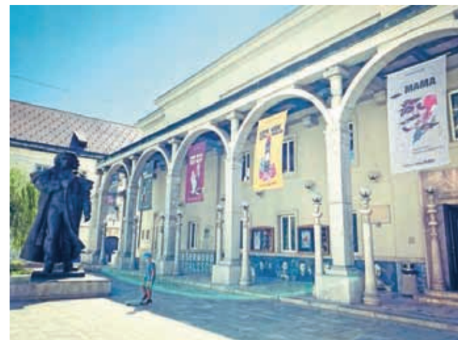
Pročelje Prešernovega gledališča je že v znamenju nove sezone, ki prinaša pet predstav.

Vpisi abonmajev za novo sezono se bodo začeli v ponedeljek in bodo v prvi fazi potekali tja do sredine meseca. Zaradi razmer – najbrž nihče prav natančno ne ve,