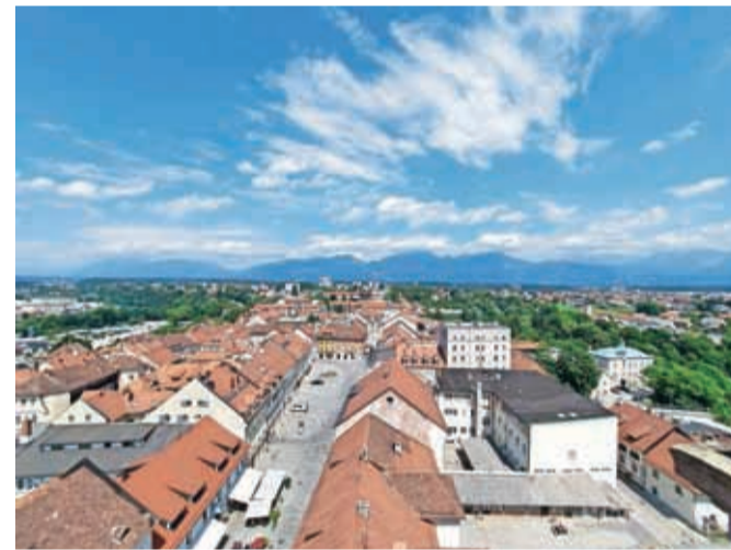
Razgled s kranjskega zvonika

Zvonik bo od 6. septembra dalje mogoče obiskati vsak dan med 9. in 17. uro. Vstopnice bodo na voljo v Turistično-informativnem centru v Kranjski hiši.