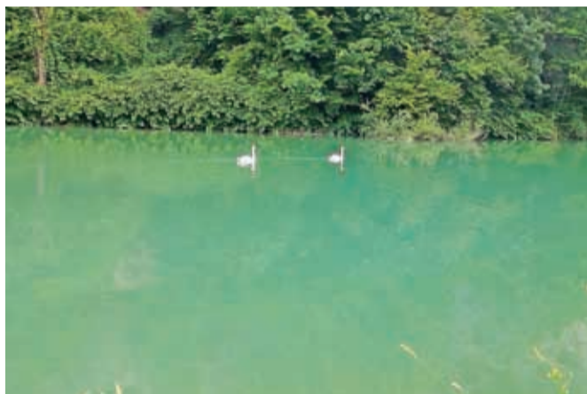
Na mestu iztoka, kjer očiščena voda priteče v Savo, se občasno pojavi sprememba barve vode.

Na mestu iztoka, kjer očiščena voda priteče v Savo, se občasno pojavi sprememba barve vode, kar je posledica svetlobe in rahle rjave obarvanosti. Rahel odtenek rjavkaste barve na iztoku se poveča, kadar je zadrževalni čas odpadne vode na čistilni napravi daljši, to je ob sušnem dotoku (manj kot 8.000 m 3 /dan). Eden od razlogov je tudi dodajanje železovega triklorida v proces čiščenja odpadne vode, ki ima izrazito rjavo barvo (po rji), uporablja pa se za obarjanje viškov fosforja, z namenom doseganja mejne vrednosti.