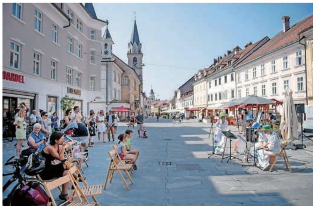
Glasbena skupina Klakradl v starem mestnem jedru je z nastopom pritegnila.

koncert. Lahko rečemo, da se je s svežimi aranžmaji ljudskih napevov iz alpsko-jadranske regije Koroško poletje v Sloveniji ustavilo v Kranju. Jeseni se bosta Kranjčanom predstavili še dve sosedi, Hrvaška in Italija.