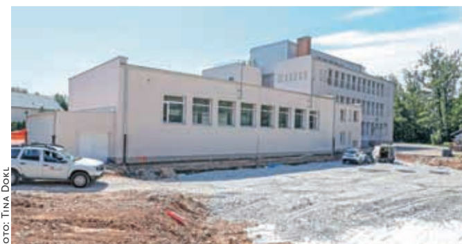
Pri OŠ Staneta Žagarja bo stekla gradnja prizidka.