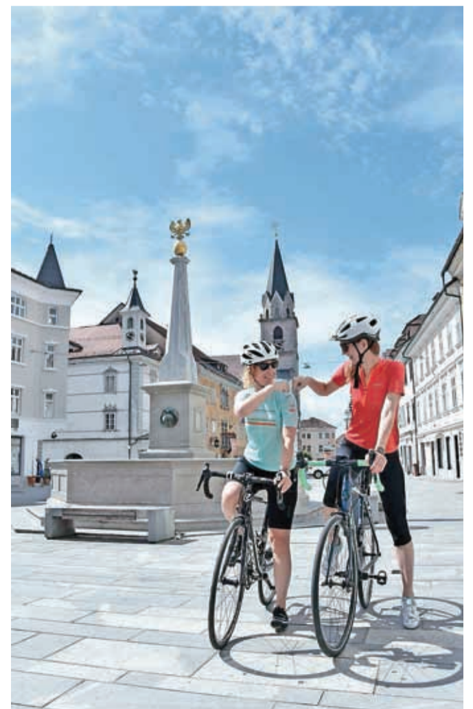
Kranjska kolesarska roža

te vračali mimo Brezij, Ljubnega, Kovorja, Dupelj in Strahinja. Jezerjanka pa s Posestva Brdo zavije proti Predosljam do Preddvora. Cesta do Jezerškega se vije po ozki dolini. Priporočamo postanek pri Planšarskem jezeru. Iz Jezerškega se nato po isti cesti vrnete nazaj do Tupalič, Hotemaž, Visokega, Šenčurja, Hrastij in nazaj v Kranj. Zemljevid Kranjske kolesarske rože z opisom poti ter kulturnih in naravnih znamenitosti boste že v septembru našli v Turistično-informativnem centru na Glavnem trgu 2 ter na spletnih straneh www.visitkranj.si .