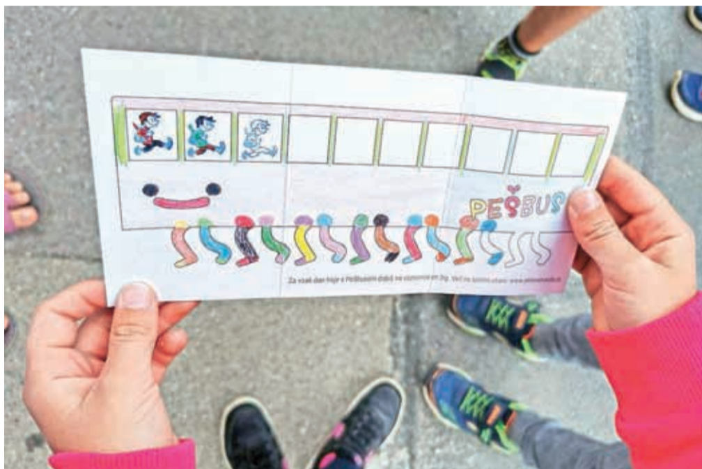
Med aktivnostmi Evropskega tedna mobilnosti v Kranju bo tudi PešBUS.

duševno zdravje, izboljšuje počutje in kakovost spanja. Dogajanje v okviru Evropskega tedna mobilnosti (ETM) se bo v Mestni občini Kranj (MOK) med 16. in 22. septembrom raztezalo od Slovenskega do Glavnega trga in Centra trajnostne mobilnosti (CTM) na Planini. Med aktivnostmi bodo e-mobilnost v Kranju, parkirni dan, PešBUS, kolesarski zajtrk, kolesarsko popoldne ... Zaključek ETM bo pri