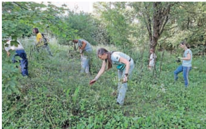
Na Bobovku so odstranjevali tujerodne rastline, ki se vedno bolj širijo v naravo.

a njeni negativni vplivi so veliko večji od koristi, zato je tudi njeno omejevanje nujno. »Obe uničujeta biodiverzitetu in zatirata domorodne rastline, kar povzroča spremembo ekosistema,« je pojasnila Rozmanova in dodala: »Teško ju bo popolnoma izkoreniniti, zato je še toliko bolj pomembno, da ju vsako leto odstranjujemo, s čimer ju krčimo in nadzorujemo njun razrast.« Tujerodni rastlini sta večletnici in