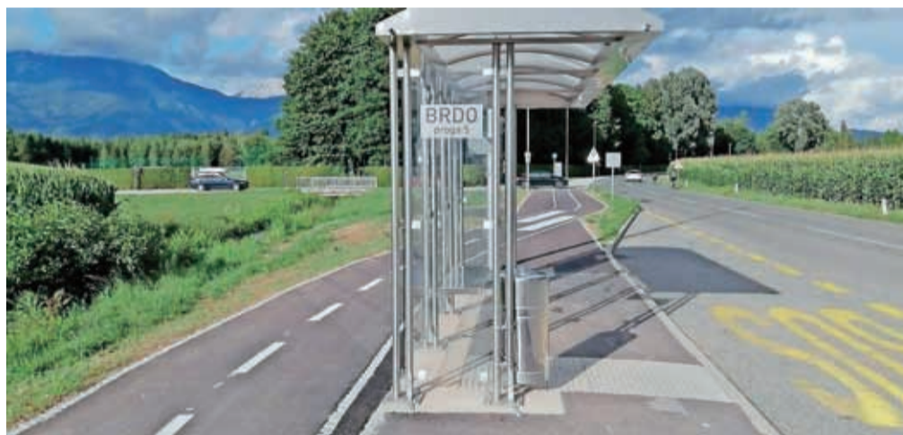
Izgradnjo kolesarske poti sta sofinancirali Evropska unija in Republika Slovenija.

Gradnjo kolesarske poti, ki prispeva tudi k večji urejenosti območja, so končali skoraj sočasno s prevzemom slovenskega predsedovanja Svetu EU, v okviru katerega bo večina dogodkov potekala ravno na Brdu. Predvsem pa gre za pomembno pridobitev za krajanje, saj zagotavlja večjo prometno varnost, z označitvijo kolesarskih pasov na relaciji Vodovodni stolp–Rupa–Kokrica–Predoslje pa je vzpostavljena tudi neprekinjena povezava za kolesarje v dolžini skoraj pet kilometrov, poudarjajo na MOK: "Z operacijo je MOK pridobno opremljenih prostorih – telovadnico bo opremil Elan Inventa, učilnice pa podjetje Lesing – bodo zagotovljeni ustrežni pogoji za izobraževanje, na novem zunanem igrišču, ki bo zdaj na levi strani šole, pa se bodo lahko rekreirali tudi mladi, ki živijo v bližini na Planini.