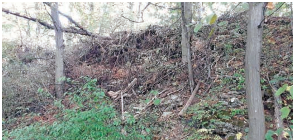
Odvržen zeleni odrez na robu naravne vrednote Gozd Huje

Kranj – Enotna transnacionalna strategija za odgovorno upravljanje in ravnanje s tujerodnimi drevesnimi vrstami bo osnovana na pilotnih primerih dobrih praks in vzpostavitev odprte mreže znanja partnerjev in ključnih deležnikov iz vključeni projektne regije: Avstrije, Nemčije, Francije, Slovenije in Italije (država opazovalka Švica). V okviru projekta bodo skupaj s projektnimi partnerji razvili transnacionalna priporočila za upravljanje tujerodnih in invazivnih tujerodnih drevesnih vrst, izdelali baze podatkov in modele oz. scenarije podnebnih sprememb, oblikovali priročnik z dobrimi praksami za upravljanje tujerodnih drevesnih vrst in vzpostavili Odprto mrežo znanja ALPTREES Hub z javno bazo podatkov, povezano z Wikialps.eu. Na Gorenjskem, ki je eno od pilotnih območij v Sloveniji, aktivnosti vodi Razvojna agencija Sora ob pomoči strokovnih sodelavcev projekta z Gozdarskega inštituta Slovenije in Zavoda RS za varstvo narave. Območne enote Kranj. V projektu aktivno sodelujejo s pilotnimi občinami Kranj, Škofja Loka, Naklo in Preddvor. Skupaj z njimi so določili pilotna območja v urbanih, periurbanih oz. primestnih in gozdnih območjih. V Mestni občini Kranj so za pilotni območji določili kanjon reke Kokre in Huje v Kranju – gabrovo-hrastov gozd, ki se nahaja v samem