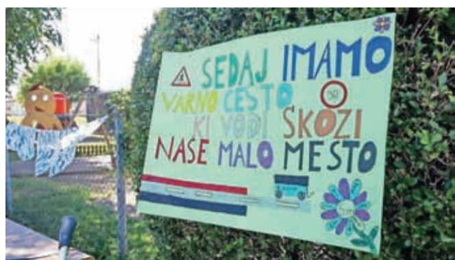
Tudi otroci so se razveselili nove ceste.

komunikacijski vodi so umaknjeni v zemljo, položena je tudi kanalizacijska cev. Zaradi razširitve ceste je bila potrebna prestavitev Jurjeve kapelice, ki je na začetku vasi Praše stala tik ob cesti. Prenos na drugo stran ceste je bil zahteven, s potrebno ojačitvijo temeljev je kapelica tehtala kar 60 ton. Obljubljeno je nadaljevanje rekonstrukcije in krajanje že težko čakajo, da stroji spet zabrnijo. Odkupi potrebnih zemljišč so pri nekaj lastnikih sicer težava, a brez razširitve ceste varnejšega prometa od Mavčič proti Kranju ne bo mogoče zagotoviti.