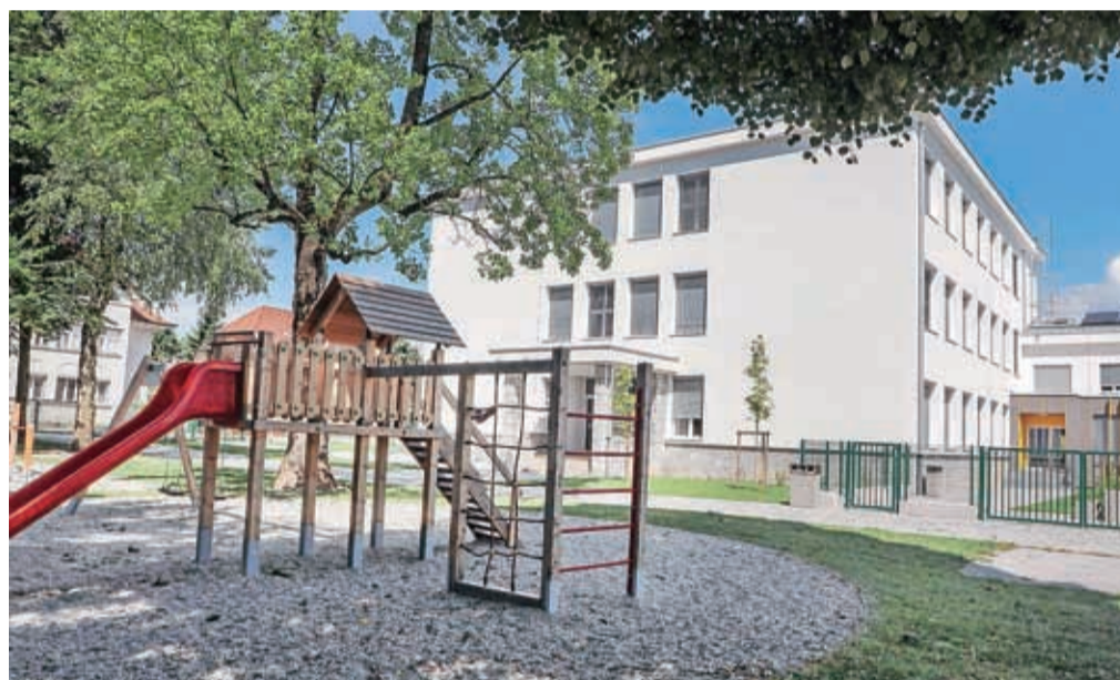
Nekdanja podružnična šola Simona Jenka – Center v novo šolsko leto vstopa kot samostojna Osnovna šola Janeza Puharja Kranj – Center.

2021/2022 je v javne in zasebne vrtnice s koncesijo na območju mestne občine Kranj (MOK) vključenih 2209 otrok, in sicer v 93 oddelkov Kranjskih vrtcev, v 31 vrtčevskih oddelkov pri osnovnih šolah in v sedem oddelkov v koncesijskih vrtcih. Javni in zasebni vrtci s koncesijo so skupno razpisali 596 prostih mest: 388 za I. starostno obdobje, 203 za II. starostno obdobje in pet za razvojni oddelk. Letos so sprejeli 527 novincev (lani 544), na čakalnem seznamu pa je trenutno 135 otrok, od tega 121 otrok iz MOK (28 otrok izpolnjuje pogoj za sprejem s 1. septembrom 2021, 93 otrok pa pogoj med šolskim letom 2021/2022) in 14 čakajočih iz drugih občin. V vrtcih je sicer še 69 prostih mest (19 za otroke I. starostnega obdobja in 50 za otroke II. starostnega obdobja), vendar pa nekateri otroci ostajajo na čakalnem seznamu kljub prostim mestom, saj želijo starši otroka vključiti v točno določen vrtec in nikamor drugam. Število čakajočih se bo v prihodnje zagotovo še spreminjalo.