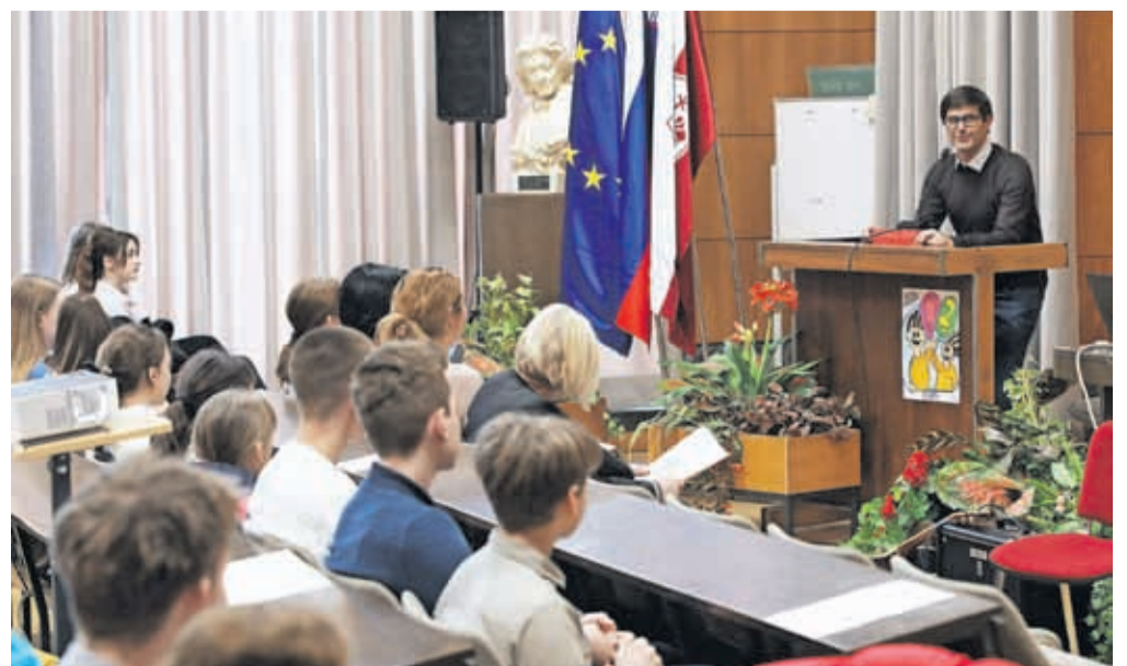
Dvorana Mestne občine Kranj je bila polna mladih razpravljavcev.

Ukrajini drugačen, da se je s tem treba soočiti in se o tem pogovarjati. »V življenju vsi kdaj zapademo v krizo, zato danes svobodno sprašujte, podajajte svoja mnenja, da boste imeli moč in znanje pomagati ljudem, ki se znajdejo v duševni stiski.«