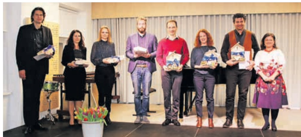
Ravnatelji in predstavniki sodelujočih glasbenih šol

okusu najljubši nastop, naj bo to skupina sedmih tolkalcev iz blejske šole, swingovski duet tolkalca ob klavirju z Jesenic, morda odlični trio violončela, saksofona in klavirja z ljudskim motivom v džezovski preobleki iz Trziča, morda kitarski nastopi iz Furlanije ali pa vrhunska flavtistka iz avstrijske Koroške, odlična izvedba Chopinove skladbe iz Škofje Loke, navdušil je Blok band, nenavaden sestav desetih kljunastih flavt z ritem podpora »groove« bas kitare, tamburina in cajona. Večer je zaključil Mladinski pevski zbor kranjske šole. Omenjamo le nekatere izmed zanimivih točk, a so prav vse prejele topli aplavz, kar je lep dokaz, da glasbenih talentov v naših krajih ne manjka. Ob letu osorej bo srečanje pripravila Glasbena šola Trzič.