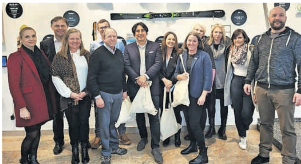
Delegacija Colorado Springsa na obisku v kranjski Kovačnici

ter Gimnazijo Franceta Prešerna. Njeni dijaki in dijakinje so namreč lani sodelovali v programu Young Champion Ambassador, ki je bil prvi skupni projekt med mestoma, in tudi tokrat so jih kranjski srednješolci navdušili s predstavitvijo dosežkov. Kranjski gostitelji so ameriški delegaciji predstavili tudi Ljubljano, Obalo in Bled, ogledali pa so si tudi tekmo v smučarskih skokih na nordijskem prvenstvu v Planici. »Med obiskom so vzniknile nove ideje za povezovanje med mestoma, tako da se v bližnji prihodnosti najverjetneje obeta nadgradnja sodelovanja in utrjevanje mednarodnih vezi s tem ameriškim mestom, v katerem je med drugim tudi sedež ameriškega olimpijskega in paralimpijskega komiteja,« so po končanem obisku sporočili z Mestne občine Kranj.