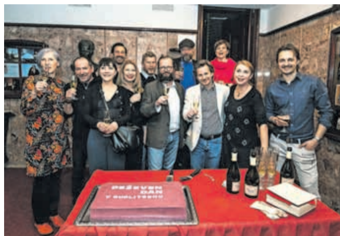
Ustvarjalci še ene odlične predstave Prešernovega gledališča, drame Deževen dan v Gurlitschu