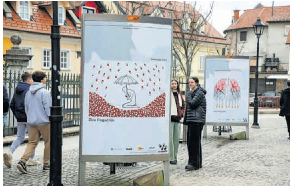
Pri ustvarjanju na temo zasvojenosti so dijaki pokazali veliko kreativnosti.