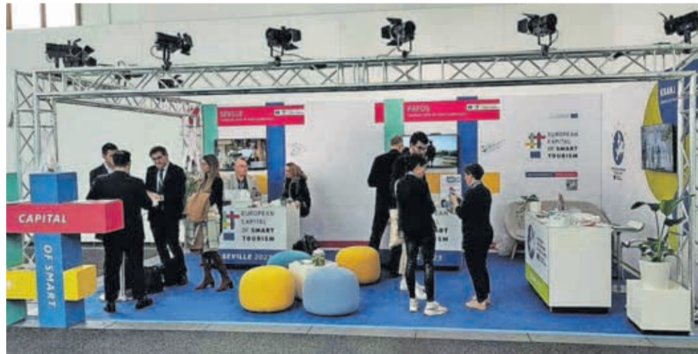
Kranjska stojnica si je delila razstavni prostor Evropske komisije skupaj s Sevillo in Pafosom, evropskima mestoma pametnega turizma 2023.