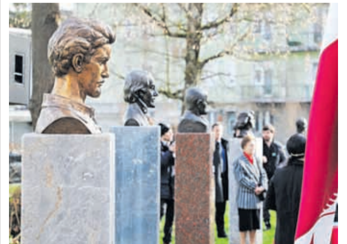
Na poti Prešernovih sodobnikov se je našemu Prešernu pridružil še madžarski pesnik Sándor Petőfi.

V nadaljevanju popoldneva je sledil sprejem v občinski