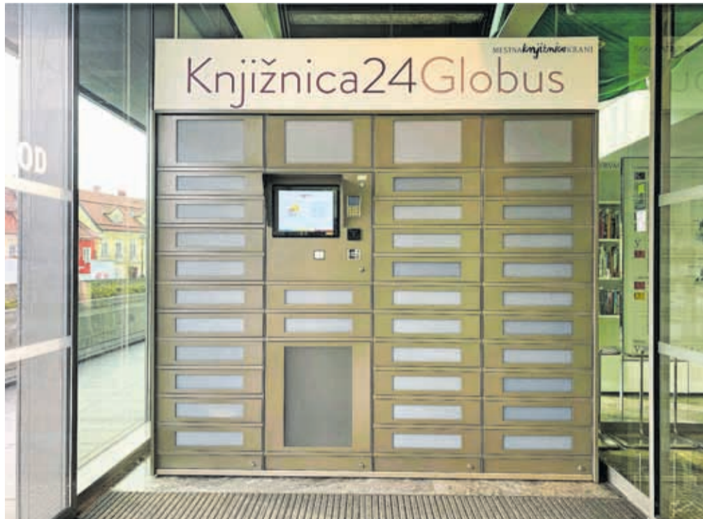
Za prevzem knjig kadarkoli v 24 urah se odslej lahko »pogovorite« s K24G.

Pobudnik in sedaj tudi ponudnik predstavljene rešit-