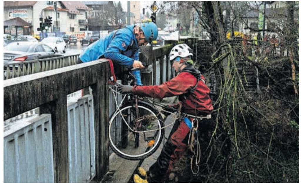
Ustrezno opremljeni in usposobljeni so se lotili tudi čiščenja kanjona Kokre.

V petek je čiščenje potekalo v okolici sodelujočih vrtcev, osnovnih in srednjih šol. Ob tem so na OŠ Janeza Puharja Kranj - Center izvedli EkoDan, na katerem so svoje delovanje predstavili Ko-