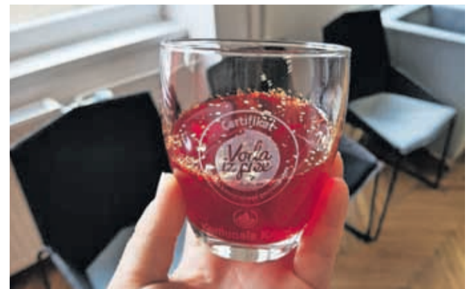
Najbolj kakovostna in tudi najcenejša pitna voda v Sloveniji je voda iz pipe!

Na Turističnem vodnem dnevu je Zavod za turizem in kulturo Kranj uradno postal prejemnik certifikata Voda iz pipe, katerega namen je dvigniti zavest o kakovosti pitne vode ter spodbujati dobre prakse s področja uporabe pitne vode, je povedal Iztok Rozman iz Zbornice komunalnega gospodarstva. »Smo nosilci platinastega znaka Zelene sheme slovenskega turizma in naziva evropska destinacija odličnosti. Delovati trajnostno sega tudi na področje odnosa do vode. K certifikatu smo pristopili, ker se zavedamo kakovosti naše vode in pomembnosti varčnega in skrbnega odno-