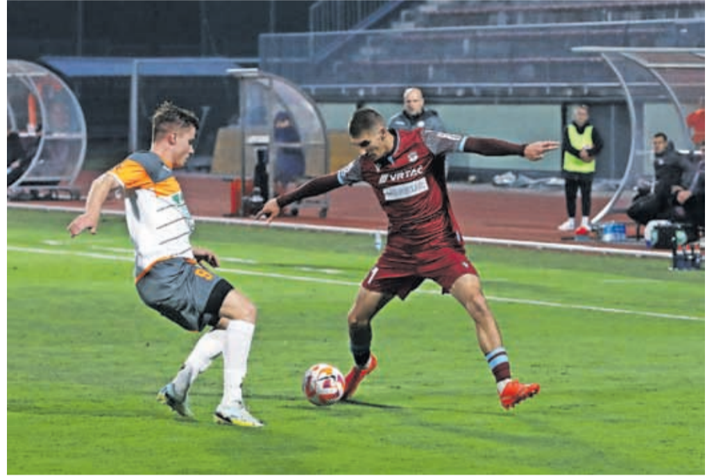
Nogometašem Triglava v pomladanskem delu prvenstva doma še ni uspelo zmagati, so pa osvojili vse točke na gostovanjih.