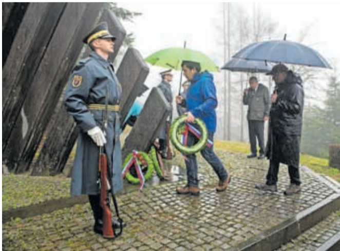
K spomeniku NOB na Planici nad Crngrobom so tradicionalno položili tudi vence.

moralno pravico ponovimo 'nikoli več', povzdignemo glas proti vojnem in nasilju, glas za mir, sožitje, blagor ljudi in narodov, spoštovanje človekovih pravic in človeško dostojanstvo vseh,« je poudaril. Prisotne sta s krajšima nagovoroma pozdravi-