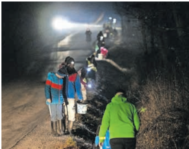
Akcija prenosa žab čez cesto pod Joštom je bila zelo dobro obiskana.

severno od Bobovških jezer in skozi gozdiček ob jugozahodnem robu Brda pa so večkrat zaprli za več ur. Kot poudarjajo v Zavodu za varstvo narave, s takšnimi akcijami v času spomladanskih