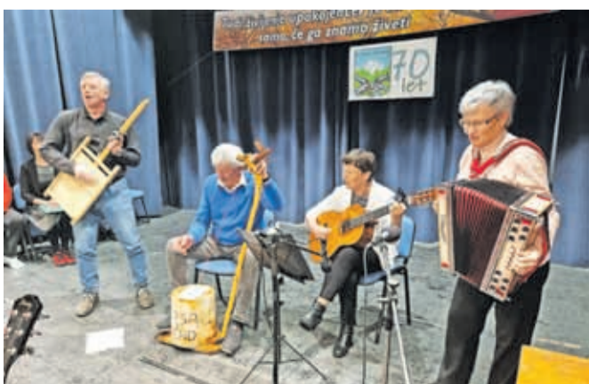
V kulturnem programu ob 70-letnici društva je nastopil tudi Gasa bend.