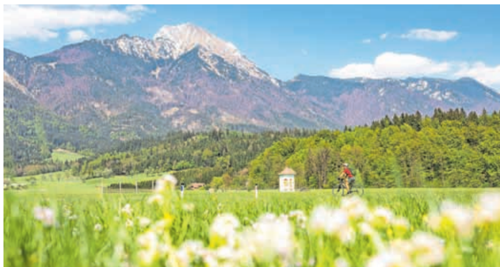
Sezona kolesarjenja se je začela.

Nadenite si čelado, kolesarska oblačila – in hop na kolo, sončni dnevi vas kličejo! Če iščete namig za naslednji kolesarski izlet, bo Kranjska kolesarska roža pravi odgovor za vas. Sestavlja jo šest kolesarskih poti, ki vas iz Kranja do bližnjih mest popeljejo mimo čudovitih naravnih in kulturnih biserov. Kamničanka vas pri Voklem najprej zapelje na edini kolesarski most čez avtocesto v Sloveniji. Peljali se boste mimo gradu Strmol, skozi staro mestno jedro Kamnika in mimo Arboretuma Volčji