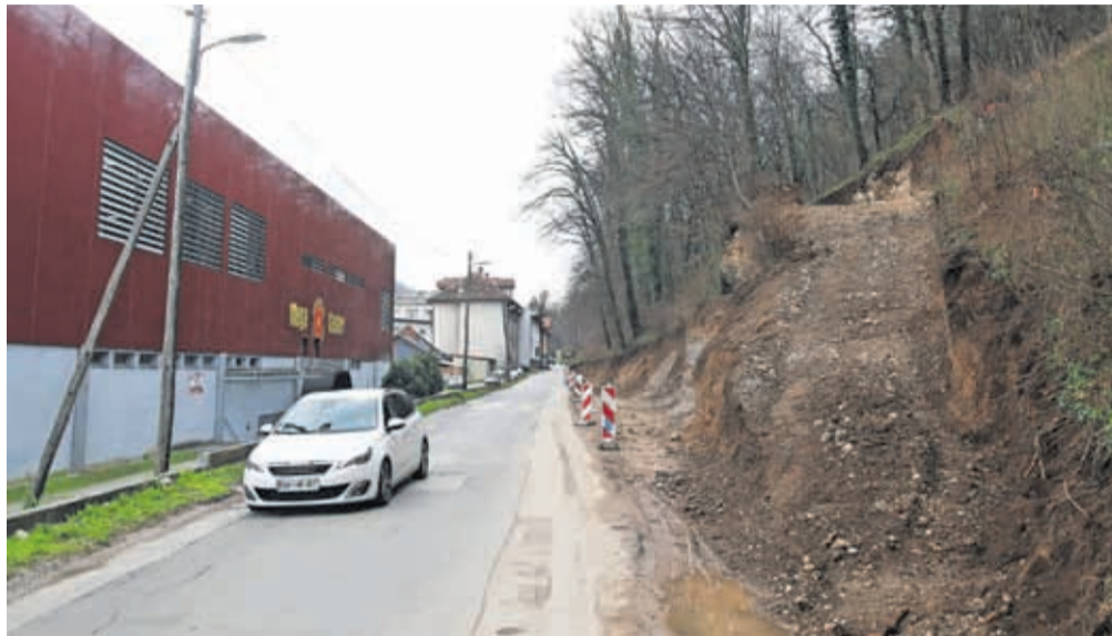
Poleg izgradnje opornega zidu bodo Savsko cesto na tem delu tudi razširili.

Kranj – Na Savski cesti v Kranju izvajajo prvo fazo gradnje opornega zidu. Okoli 700 tisoč evrov vredna gradnja bo trajala predvidoma do konca letošnjega avgusta. Zaradi del je vzpostavljena polovična zapora ceste, promet poteka izmenično enosmerno ob pomoči semaforjev. Izvajalec Euro grad gradi oporni zid v dolžini 120 metrov in višini do največ 5,5 metra. V prvi fazi dela potekajo ob objektu Mega Center Kranj, v drugi fazi pa bodo še na preostalem delu tega kraka Savske ceste. Največja pridobitev te investicije bo poleg utrjene brežine širša cesta. Širina vozišča bo namreč namesto