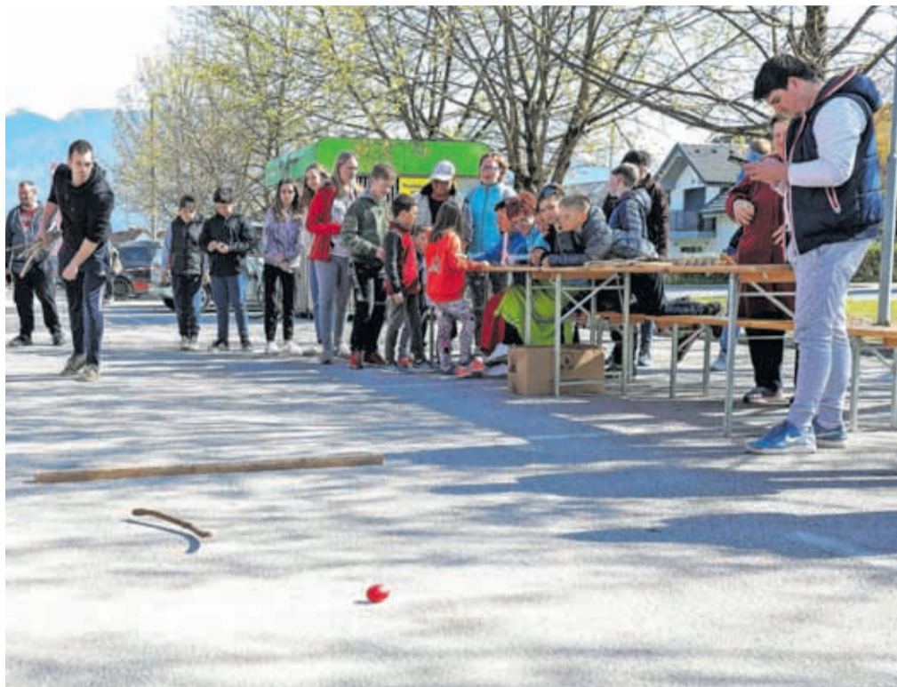
Zbijanje pirhov s krivo palico na Kokrici