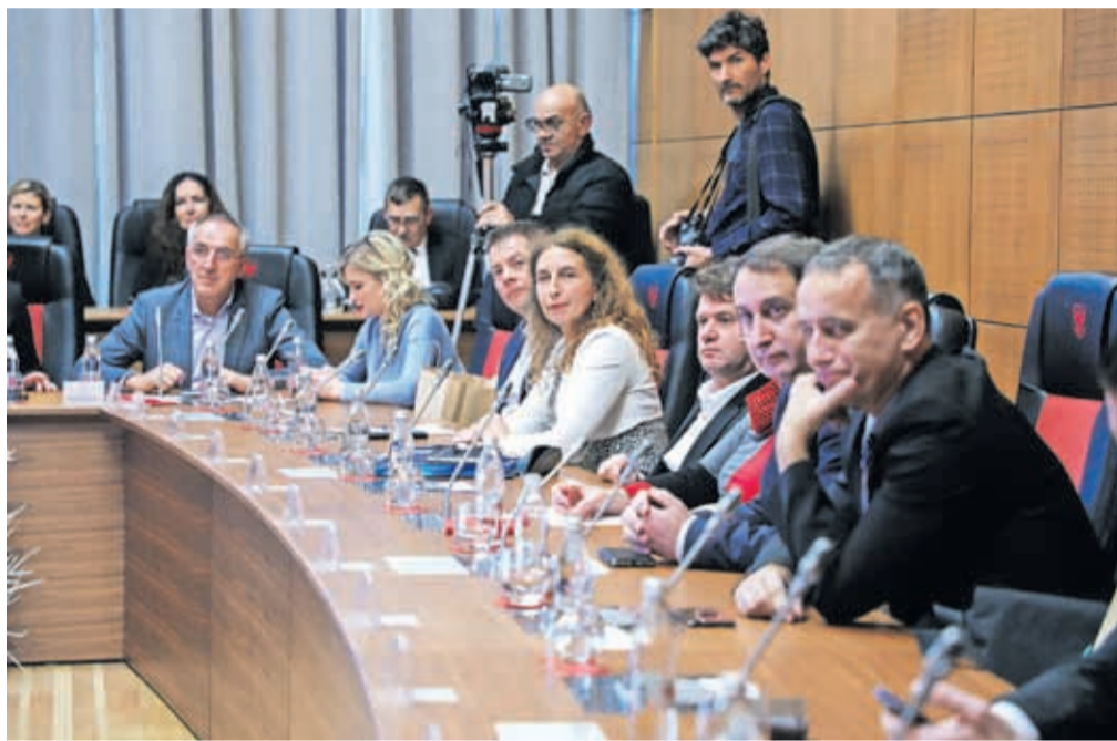
Kranjski mestni svetniki so rebalans proračuna sprejeli soglasno.