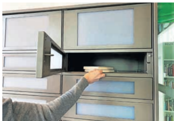
Naročene knjige vas bodo čakale v predalu.