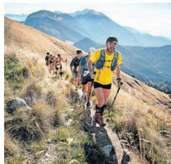
Ekipa Julian Alps Trail Run pripravlja osem tekaških druženj na različnih slovenskih destinacijah.

Kako bo vse skupaj potekalo? Predvidena je tekaška trasa, kjer bomo čim večji delež odtekli predvsem v naravi, na stezicah, kar je tudi glavni čar trail teka. Dolžina je okoli 15 kilometrov, tako da ne bo šlo za prezahteven teren, saj je dogodek namenjen predvsem tekaškemu druženju in ni tekmovalnega značaja. Raziskovali boste stezice v okolici Šmarjetne gore in Sv. Jošta nad Kranjem.