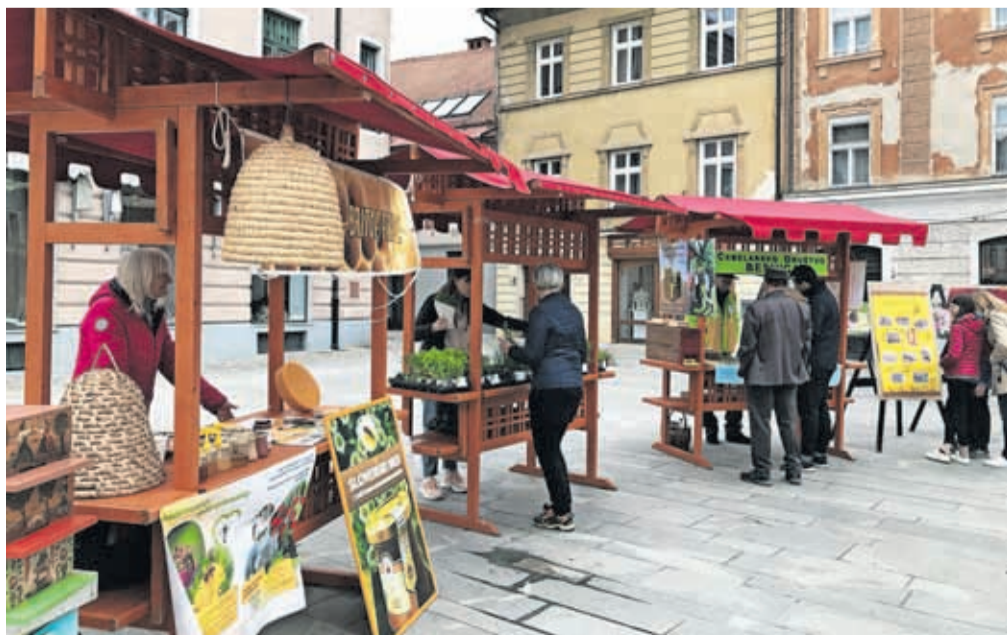
Dejavnost čebelarstva lahko podrobneje spoznate 22. aprila na sobotni tržnici ob vodnjaku.

okolju, lahko zanje poskrbite tudi sami, in sicer z zasaditvijo medovitih rastlin, odloženo prvo košnjo trave in sajenjem avtohtonih rastlin. S tem namenom bomo mimoidočim delili medovite rastline, ki bodo krasile balkone, okenske police in vrtove ter čebelam omogočale nujno potrebno medicino in cvetni prah na cvetočih delih rastlin v poletnem času.