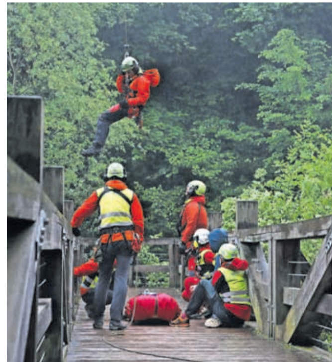
Na Dnevu gorskih reševalcev so prikazali tudi reševanje iz kanjona Kokre.