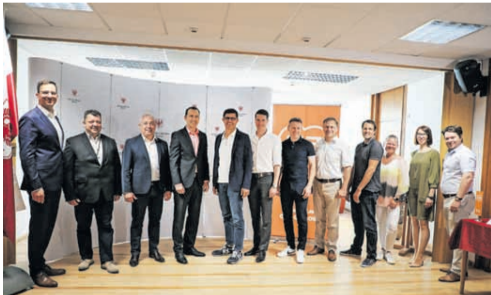
Na Mestni občini Kranj so družbo T-2 za izvajalca vzpostavitve digitalne platforme izbrali po petih krogih pogajanj.

"Naša pot je jasna: Kranj bi radi postavili na mesto vodilnih pametnih mest v Sloveniji," je povedal župan in spomnil, da platformo uvajajo v trenutku, ko je Evropska komisija izbrala Kranj v misijo 100 podnebno nev-