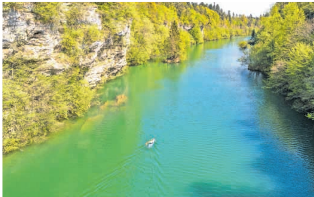
Konglomeratni kanjon Zarica