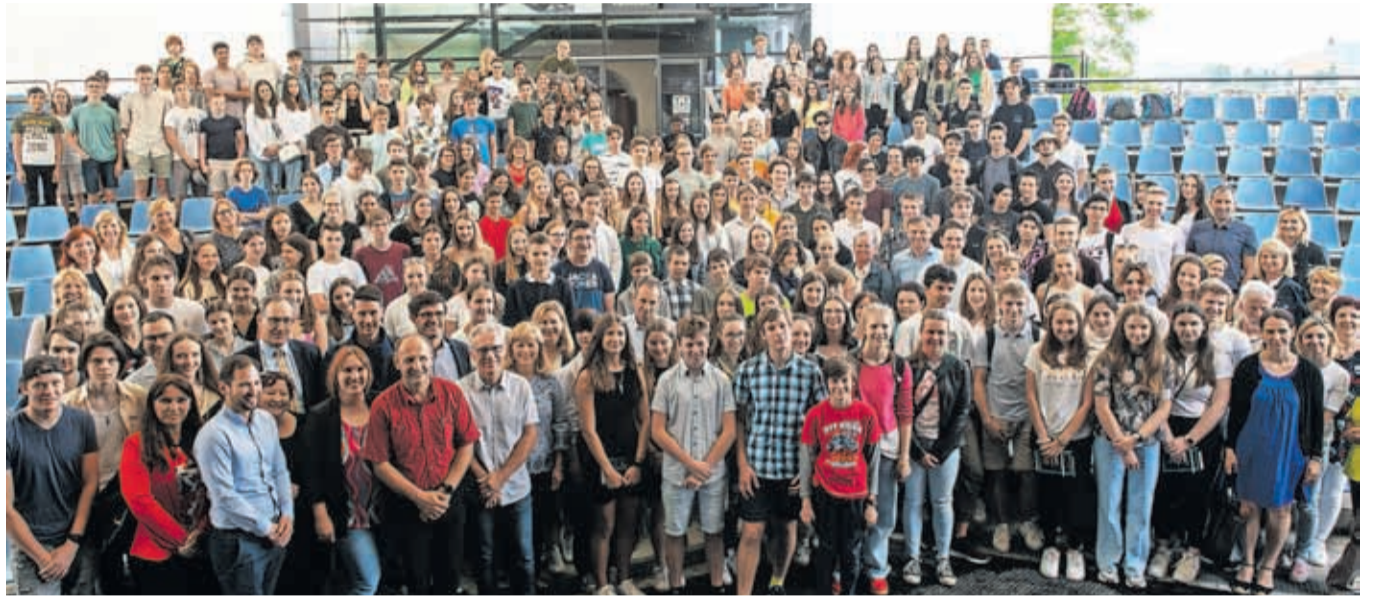
Sprejem talentov so pripravili v Letnem gledališču Khislstein.