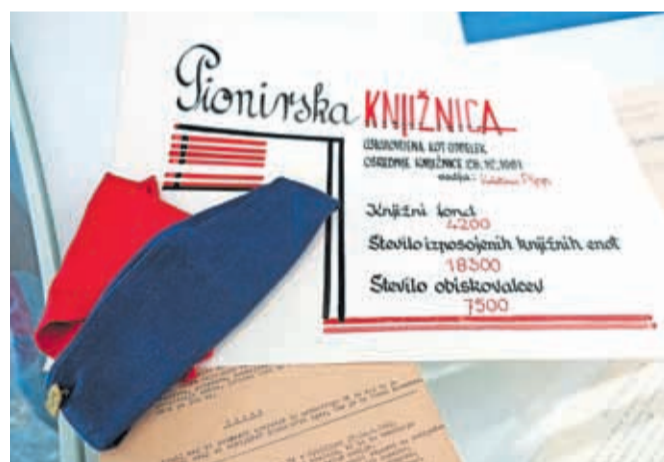
S kapico in rutko v Pionirsko knjižnico