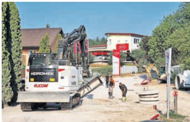
V Industrijski coni Laze občina že gradi fekalno kanalizacijo.

IC Laze je v začetku 90. let nastala na lokaciji nekdanjega glinokopa, območje pa z vidika prostorskih aktov še ni urejeno skladno z novimi okoljskimi standardi. "Na območju IC Laze imamo