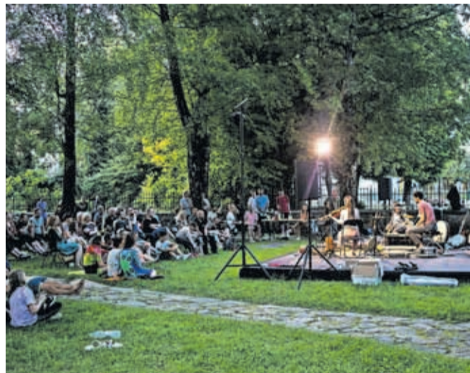
Festival Kalejdoskop v Prešernovem gaju je zaključila glasbena zasedba Širom.

Oder Trainstationa je v juniju malce bolj počival, z izjemo divjega koncerta v organizaciji domače hardcore zasedbe Sakrabort, ki so na koncertu v živo posneli tudi svoj prvi video spot za "en hud komad". S 1. julijem pa se vsi glasbeni dogodki selijo na prosto, kjer bodo na poletnem odru nastopili Emkej in Drill, Zmelkoow, Acidez, Opran možgan, Brkovi, Infected rain, Guattari, Raggalution, Smetnaki, S.A.R.S. in drugi. Vstopnice so že na voljo na naši internetni strani subart.si, kjer si lahko tudi podrobneje ogledate prihajajoče dogodke.