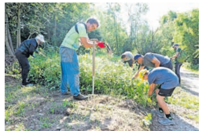
Odstranjevanja invazivnih tujerodnih rastlin na občinskih zemljiščih se je lotilo okoli sto prostovoljcev.

Kranjski župan Matjaž Rakovec, ki se je tudi sam lotil čiščenja, je poudaril, da gre pri odstranjevanju ITV za dolgotrajen proces, zato bo tovrstna akcija postala tradicionalna. Skupaj z Rozmanovo pa je pozval lastnike zasebnih zemljišč, naj se tudi sami lotijo odstranjevanja invazivk.