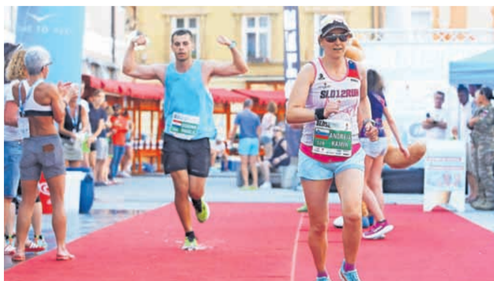
Tekači so se v Kranju pomerili na šest- in dvanajsturni tekaški preizkušnji.