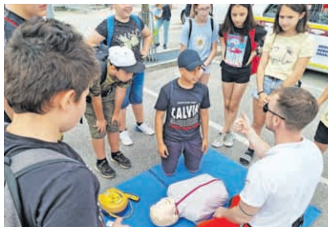
Otroci so se na Prometno varnostnem dnevu seznanili tudi s postopki oživiljanja.

tni nesreči. Predstavile so se tudi vse interventne službe, ki skrbijo za varnost v prometu – od medobčinskih rederjev, policistov do gasilcev in ekipe nujne medicinske pomoči.