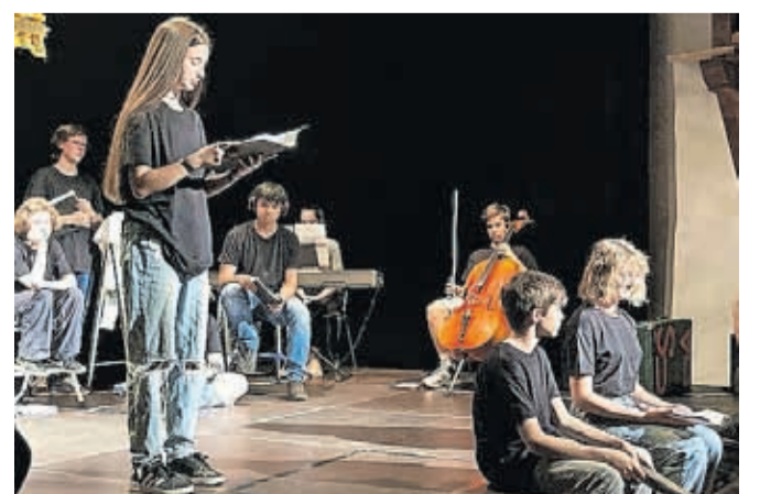
Literarni večer v Škrlovcu