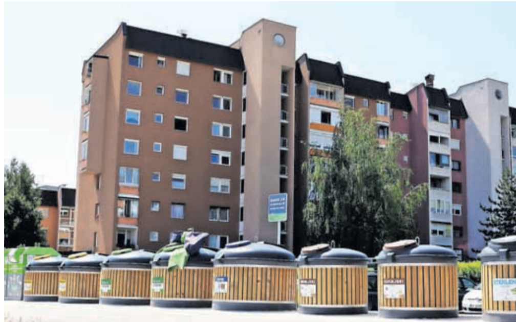
Podzemne zbiralnice odpadkov izboljšujejo tudi urejenost lokacije.

Zabojnike so razvili na Švedskem, izdelali pa v Sloveniji. Vkopani so meter in pol globoko v podlago, zato zasede-