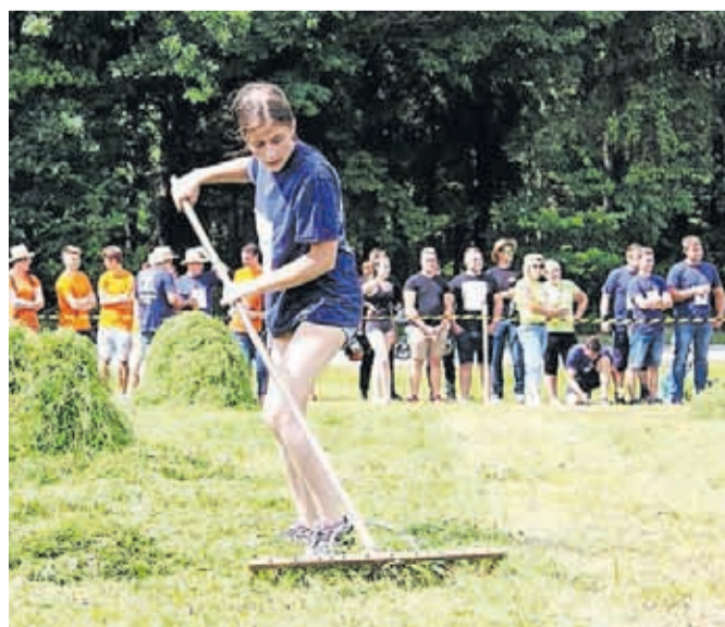
Tekmovali bodo tudi v grabljenju.

Goriče – Prvo soboto v juliju (2. julija) vabljeni na Državne kmečke igre. Potekale bodo v Goričah pri Kranju, program se bo začel ob 12. uri. Gre za največji dogodek podeželske mladine v Sloveniji in z gostujočimi ekipami iz tujine. Organizira jih Društvo kranjske in tržiške podeželske mladine, katerega tekmovalci so dosegli najboljše rezultate na zadnjih igrah v letu 2019. V programu si boste lahko ogledali tekmovanje ekip v košnji, grabljenju in treh spretnostnih igrah. Predstavljena bo kmetijska mehanizacija, potekal bo sejem s tržnico domačih dobrot, zvečer pa sledi veselica z ansamblom Stil.