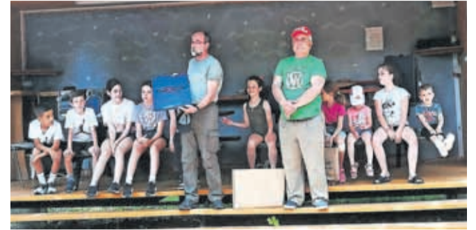
V društvu Morača iz Kranja so proslavili črnogorski dan samostojnosti.