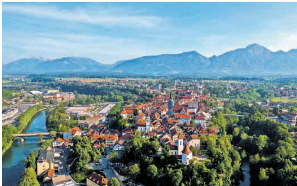
Kranj nosi naziv zelene destinacije z zlatim znakom.

še užitekarsko kopati v njej. Film z vrhunsko zgodbo, sliko in glasbo bo v Kranju 7. julija ob 21. uri na Vovkovem vrtu. Predvajanju se bo pridružila tudi ekipa ustvarjalcev, zato strasti in čustev ne bo manjkalo. Vabljeni k ogledu in k veslaškemu namigu. Ni veliko mest na svetu, mimo katerih tečeta divji alpski reki, zato v razmislek, da lahko vsak izmed nas naredi nekaj zanj, navsezadnje Kranj nosi naziv zelene destinacije z zlatim znakom.