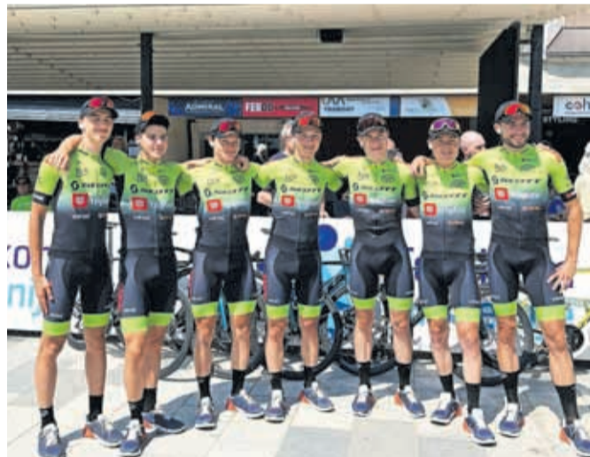
Kolesarji Kolesarskega kluba Kranj na dirki Po Sloveniji