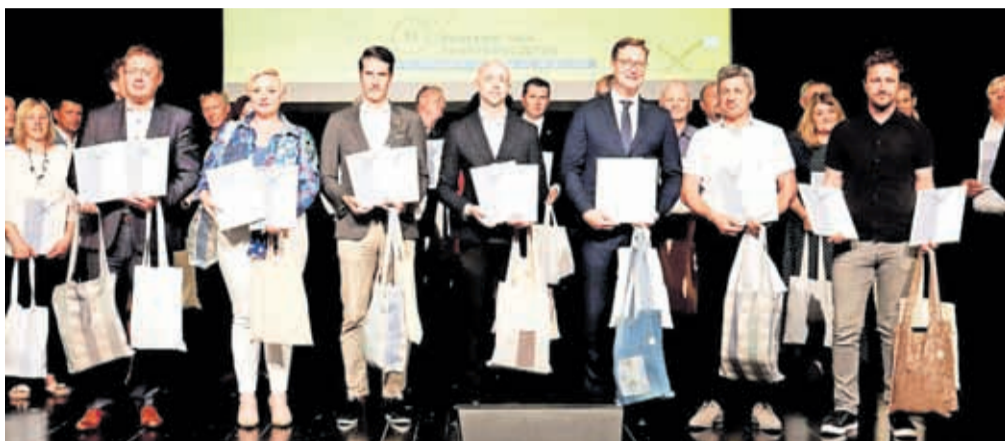
Naziv prostovoljstvu prijazna občina so potrdili 34 občinam.

Letos je komisija prvič podelila tudi posebna priznanja za večletno spodbujanje prostovoljstva, neomajno podporo delovanju prostovoljskih organizacij in izjemen