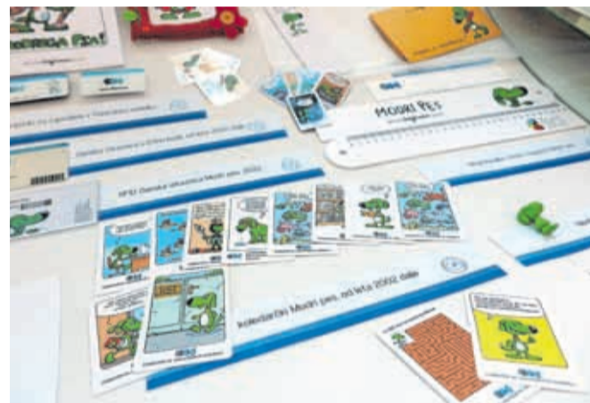
V novem tisočletju je Bineta zamenjal Modri pes.