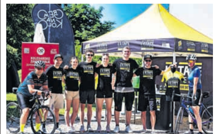
Pripravljamo se na L'Étape Slovenia. / FOTO: PETER PODOBNIK/SPORTIDA

Kranj – Med 3. in 4. septembrom bo Kranj postal najbolj priljubljeno mesto ljubiteljev kolesarjenja. L'Étape Slovenia, ki deluje pod okriljem Tour de France, je družabni kolesarski dogodek s tekmovalno noto za amaterske kolesarje ob zagotavljanju varnega kolesarjenja na za promet zaprtih cestah in približevanje izkušnje etapne dirke profesionalnih kolesarjev na Dirki po Franciji. Ambasador dogodka je Matej Mohorič, ki trenutno vozi za ekipo Bahrain Victorious.